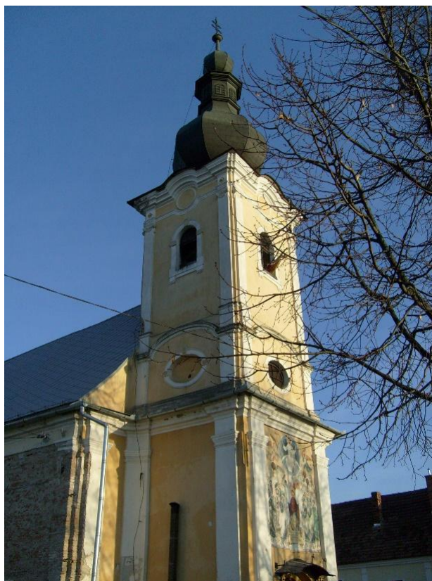
Fig. 5. Biserica de Piatră cu hramul Învierea Domnului