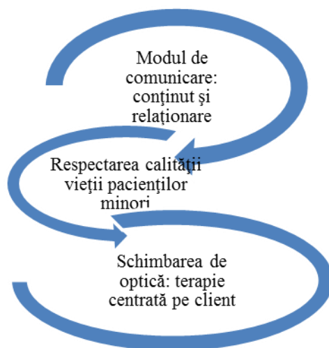
Fig. nr. 1. Modelul posibilităților de ameliorare a situației pacienților minori (sursa Albert-Lorincz, 2013 p. 160.)

Avem convingerea că primul pas în ameliorarea și îmbunătățirea îngrijirii pacienților minori este schimbarea de optică asupra problemei tratate. Aceasta înseamnă trecerea progresivă de la centrarea terapeutică asupra bolii spre o mai bună luare în considerare a personalității pacientului, „adică spre o focalizare pe subiectul unic și complex ... prin care ar face posibilă ameliorarea stării de sănătate a populației” (Mârza-Dănilă, 2009, p. 51). Această trecere este posibilă doar prin renunțarea la centrarea terapeutică asupra bolii în favoarea respectării dimensiunilor de personalitate a medicilor și a pacienților. Este nevoie de un parteneriat între personalul medical, părinți și copilul pacient. Parteneriatul se realizează cu condiția interrelaționărilor reciproce. Aceste interacțiuni pot genera mulțumire atât din partea personalului din domeniul sanitar cât și din partea beneficiarilor. Astfel se asigură satisfacerea nevoilor de bază ale pacienților și se respectă mai mult dreptul la calitatea de viață pozitivă, ceea ce este considerat de noi ca al doilea factor de ameliorare a situației pacienților minori – primul fiind schimbarea de optică și centrarea pe personalitatea pacientului.