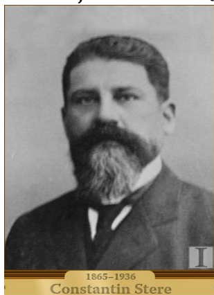
1865-1936 Constantin Stere