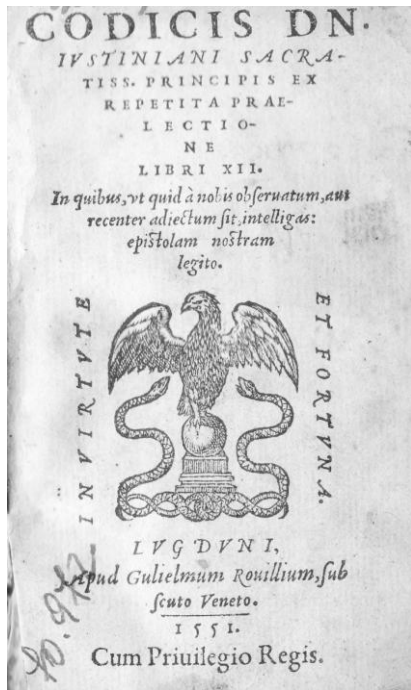
Codex Iustinianus , Lyon, 1551.