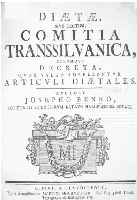
Joseph Benkő, Dietae sive rectius comitia Transsilvanica , Cluj-Sibiu, 1791.