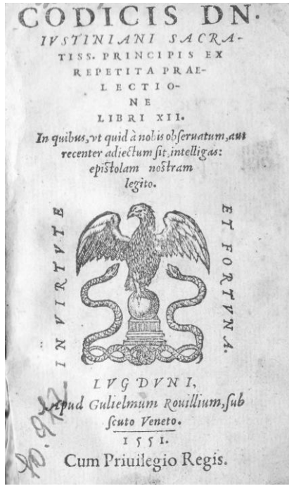
Codex Iustinianus , Lyon, 1551.