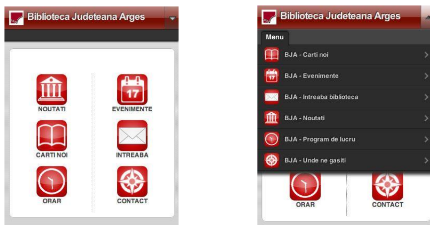
Figura 2. Ecrane de întâmpinare al site-ului www.bjarges.ro Ecran cu afișare tip simbol (stânga) și ecran cu afișare text (dreapta)

Ecranul de întâmpinare este cel din Fig. 2.