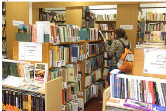
Biblioteca Județeană Mureș