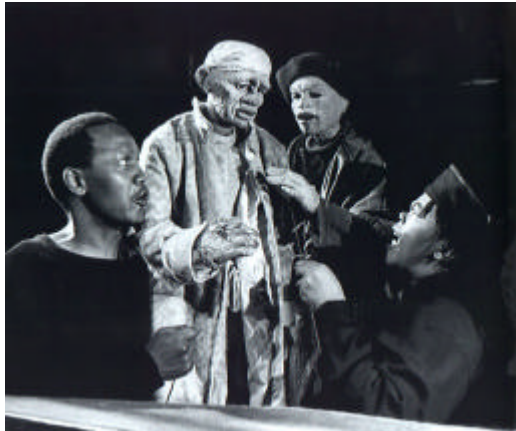
Fig. 1.1: Woyzeck on the Highveld (1992). Marionnette: Adrian Kohler

3.1. Woyzeck on the Highveld 2 (1992) est un regard décapant sur les réalités sud-africaines des années 1950: pauvreté, injustice sociale, industrialisation aride, désespoir de l'individu. Le spectacle traite de la lutte d'un travailleur saisonnier contre une société insensible. Adaptation d'après Woyzeck de Georg Buchner (1837), la production de ce spectacle sous la direction de Kentridge marque la première collaboration de l'artiste avec la Handspring Puppet Company . Kentridge met en scène marionnettes et film d'animation pour mieux illustrer l'univers intérieur torturé de Woyzeck , ainsi que pour articuler précisément ce transfer culturel du texte européen dans le contexte sud-africain.