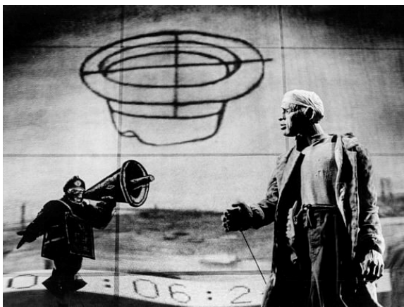
Fig. 1.3: Woyzeck on the Highweld (1992). Animation: William Kentridge.

– à chaque fois que le docteur se penche pour ausculter Woyzeck, apparaît en projection une «oreille». Lorsque le docteur approche le stéthoscope de son oreille à lui, comme pour analyser ou comparer en quelque sorte la «captation» de l'univers intérieur de Woyzeck, apparaît en projection un «mégaphone». Pragmatiquement, la fonction de l'oreille est celle de patient qui convoque le thème de l' obéissance . Le mégaphone, par son pouvoir de diffuser et, surtout, d'augmenter les sonorités, est représentatif de la fonction d' agent . Dans le contexte de la pièce, le mégaphone apparaît plusieurs fois (pour un exemple, voir Figure 1.3 ), pour symboliser donc un agent de répression, puisque c'est souvent un instrument d'oppression, ou encore de manipulation: il menace ou domine les foules par le pouvoir du son augmenté.