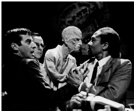
Fig. 2.1: Faustus in Africa (1994). Marionnette de Faust, réalisation: A. Kohler.

ces restes renvoient aux victimes de l'apartheid. Le gestus social 5 a ainsi été posé; ses effets devraient amener le spectateur à cette action critique dont rêvait Brecht.