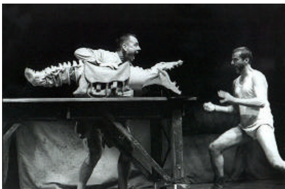
Fig. 3.2: Ubu and the Truth Commission (1998). Marionnette du crocodile , réalisation: A. Kohler.

L'autre marionnette (voir Figure 3.2 ), le crocodile , représente un animal d'Afrique et, en même temps, l'animal politique féroce de la société sud-africaine, un « mangeur » de preuves. C'est parce que bien des preuves ont été « effacées » que l'on a opté pour cette forme rare de récupération de la vérité, donc de la mémoire du passé, qu'est la Truth and Reconciliation Commission . L'image du crocodile qui avale les preuves incriminantes est ainsi très suggestive de faits réels qui ont marqué l'histoire récente de l'Afrique du Sud.