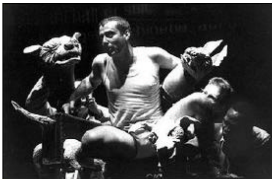
Fig. 3.1: Ubu and the Truth Commission (1998). Marionnette des chiens de guerre, réalisation: A. Kohler.

The character of the three-headed dog – three different characters reluctantly sharing one fate – became part of the heart of the material of the play. What started its life as a kind of technical concern, or as a limitation [références aux difficultés de manipulation de trois marionnettes séparées, vu le personnel artistique limité], became a character in its own right and carried with it a whole weight of associations. 8