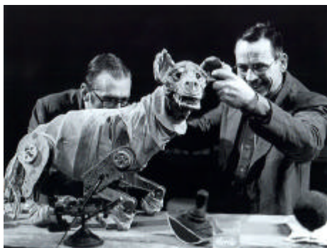
Fig. 2.2: Faustus in Africa (1994). Marionnette du chien , réali- sation: A. Kohler.

Pour ce qui est de Faust, bien qu'il soit difficile de dire qui il représente exactement, il semble incarner ce colonisateur qui aurait vendu son «âme» et qui, à travers cette cruelle aventure coloniale, écrase la notion même d'«humanité». Une idée intéressante pour la figure de Faust, en rapport avec ce qui vient d'être dit sur son apparence scénique et la constitution physique de la marionnette, pourrait être celle que le «Diable n'est pas noir, mais blanc». L'image se constituerait donc en un discours politique accusateur d'autant plus puissant que ce sont les moyens scéniques qui le réalisent.