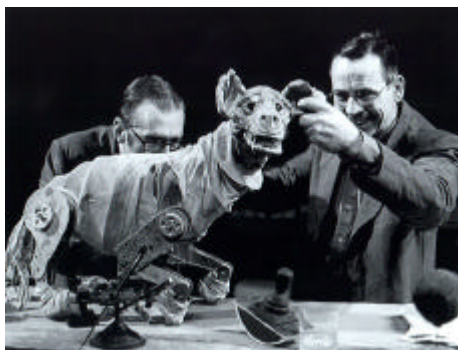
Fig. 2.2: Faustus in Africa (1994). Marionnette du chien , réali- sation: A. Kohler.

Pour ce qui est de Faust, bien qu'il soit difficile de dire qui il représente exactement, il semble incarner ce colonisateur qui aurait vendu son «âme» et qui, à travers cette cruelle aventure coloniale, écrase la notion même d'«humanité». Une idée intéressante pour la figure de Faust, en rapport avec ce qui vient d'être dit sur son apparence scénique et la constitution physique de la marionnette, pourrait être celle que le «Diable n'est pas noir, mais blanc». L'image se constituerait donc en un discours politique accusateur d'autant plus puissant que ce sont les moyens scéniques qui le réalisent.