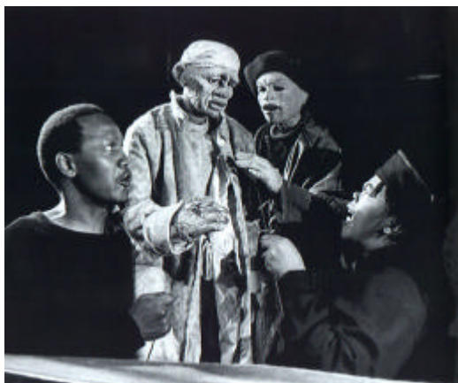
Fig. 1.1: Woyzeck on the Highveld (1992). Marionnette: Adrian Kohler

3.1. Woyzeck on the Highveld 2 (1992) est un regard décapant sur les réalités sud-africaines des années 1950: pauvreté, injustice sociale, industrialisation aride, désespoir de l'individu. Le spectacle traite de la lutte d'un travailleur saisonnier contre une société insensible. Adaptation d'après Woyzeck de Georg Büchner (1837), la production de ce spectacle sous la direction de Kentridge marque la première collaboration de l'artiste avec la Handspring Puppet Company . Kentridge met en scène marionnettes et film d'animation pour mieux illustrer l'univers intérieur torturé de Woyzeck , ainsi que pour articuler précisément ce transfer culturel du texte européen dans le contexte sud-africain.