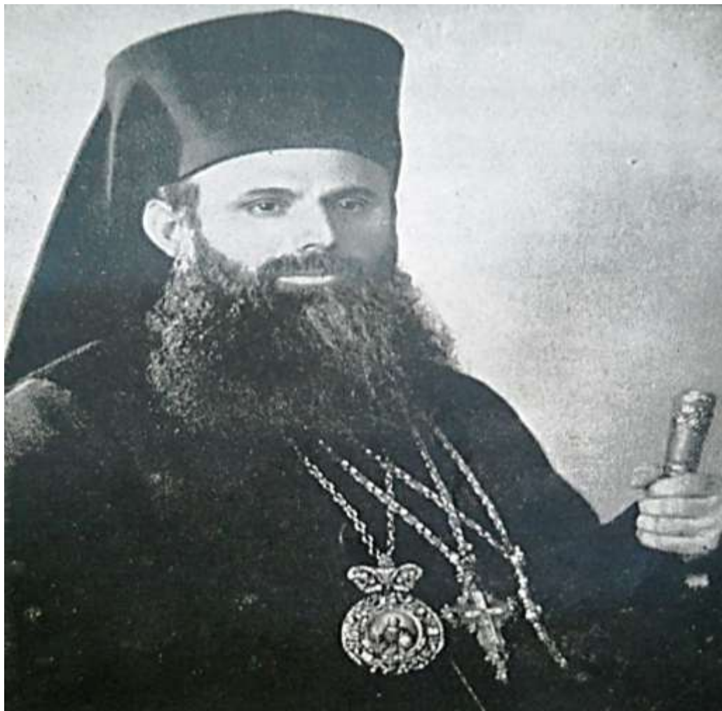
Înalt Prea Sfințitul D.D. Justinian Arhiepiscopul Bucureștilor, Mitropolitul Ungro-Valahiei și Preafericitul Patriarh al Bisericii Ortodoxe Române