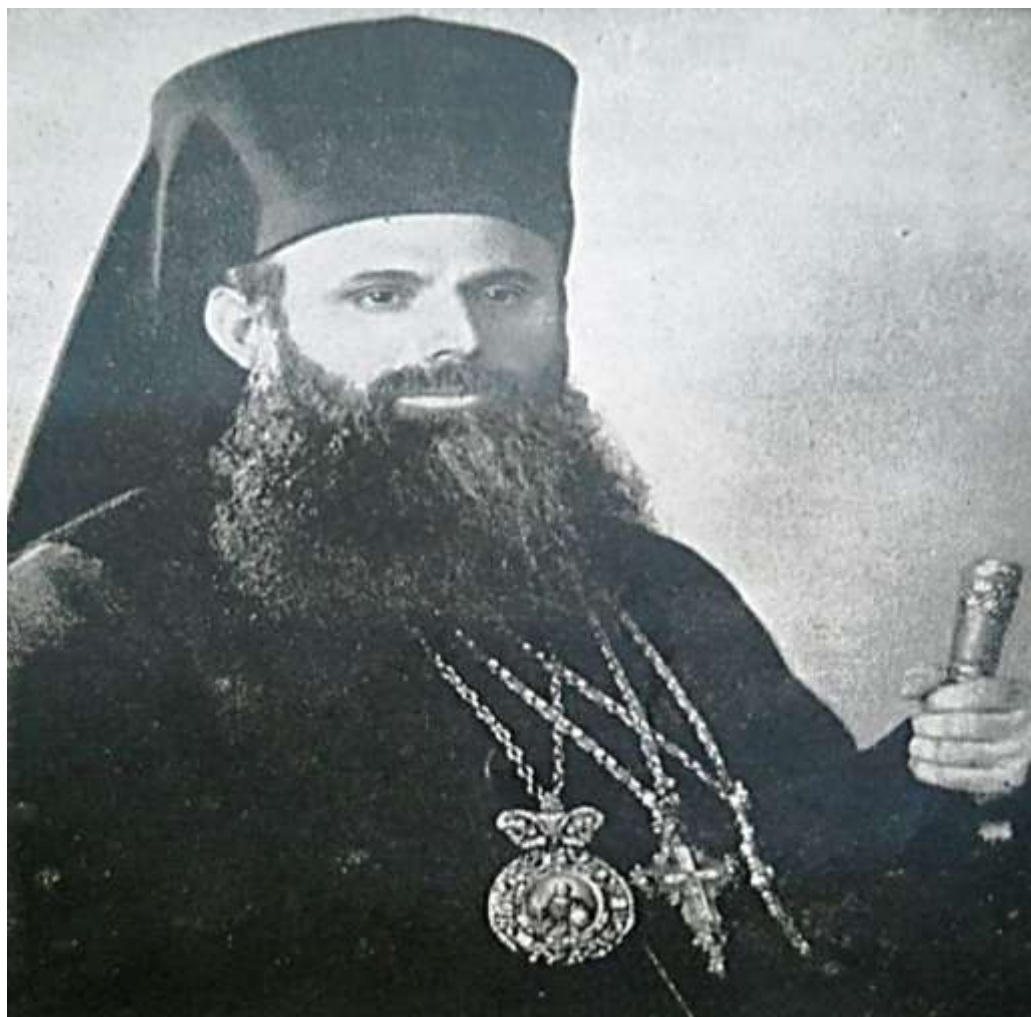
Înalt Prea Sfințitul D.D. Justinian Arhiepiscopul Bucureștilor, Mitropolitul Ungro-Valahiei și Preafericitul Patriarh al Bisericii Ortodoxe Române