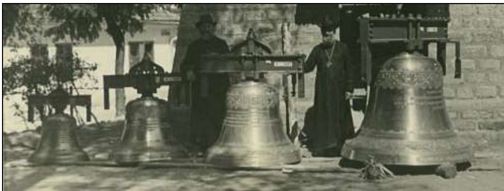
Cele patru clopote ale Episcopiei Maramureșului înainte de a fi instalate