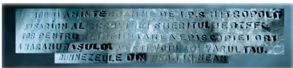
Inscripția de pe clopotul închinat Mitropolitului Visarion

• al patrulea clopot (Do diez, 230 kg, diametru 76 cm) a fost închinat Episcopului Vasile Stan al Maramureșului și inscripționat cu următorul text: „Turnatu-s-au clopotele catedralei episcopale din Sighet, în al nouălea an de domnie al Majestății Sale Regele Carol II al României și în anul I de păstorire a P.S. Sale Vasile Stan, primul episcop al reînființatei Episcopii Ortodoxe a Maramureșului, anul Mântuirii 1939!”. Mai jos apare și următoarea inscripție: „Doamne, mântuiește pe cei bine credincioși!” ( Ibidem : 222).