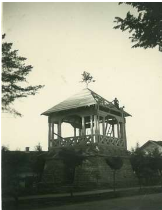
Clopotnița în timpul construcției. În vârful construcției poate fi observat „struțul maramureșean”.