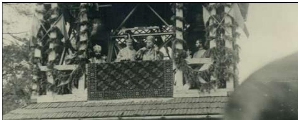
Cei trei ierarhi au rostit cuvântul lor de învățătură din clopotniță