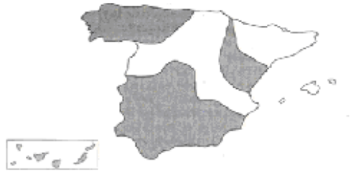
FIGURA 2. Mapa del territorio español en donde se produce el yeísmo coloreado en gris

El área estudiada es la ciudad de Gandía, situada al sur de la provincia de Valencia y a apenas 10 kilómetros de la provincia de Alicante. Se encuentra situada en el centro del dominio lingüístico del valenciano. Como se puede observar en la Figura 2 (Castelli & Mosonyi 2010) Gandía pertenece a la zona distinguidora.