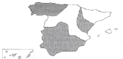
FIGURA 2. Mapa del territorio español en donde se produce el yeísmo coloreado en gris

El área estudiada es la ciudad de Gandía, situada al sur de la provincia de Valencia y a apenas 10 kilómetros de la provincia de Alicante. Se encuentra situada en el centro del dominio lingüístico del valenciano. Como se puede observar en la Figura 2 (Castelli & Mosonyi 2010) Gandía pertenece a la zona distinguidora.