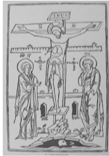
Fig. 2. Triodul-Penticostar, 1558.

P. Binder, Contribuții la cunoașterea vieții și activității diacului Lorinț , în „Studii de limbă literară și filologie”, II, 1972, p. 255–256, iar, cu referire la ediția cracoviană, Ion-Radu Mircea, Primele tipărituri chirilice și incunabulul cracovian de la Brașov , în Târgoviște, cetate a culturii românești , Partea I, Studii și cercetări de bibliofilie , București, 1974, p. 118 și p. 122.