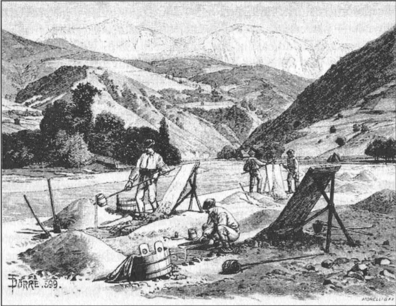
Theodor Dörre, Spălători de aur pe Valea Arieșului ( Goldwäscher im Aranyosthale ).