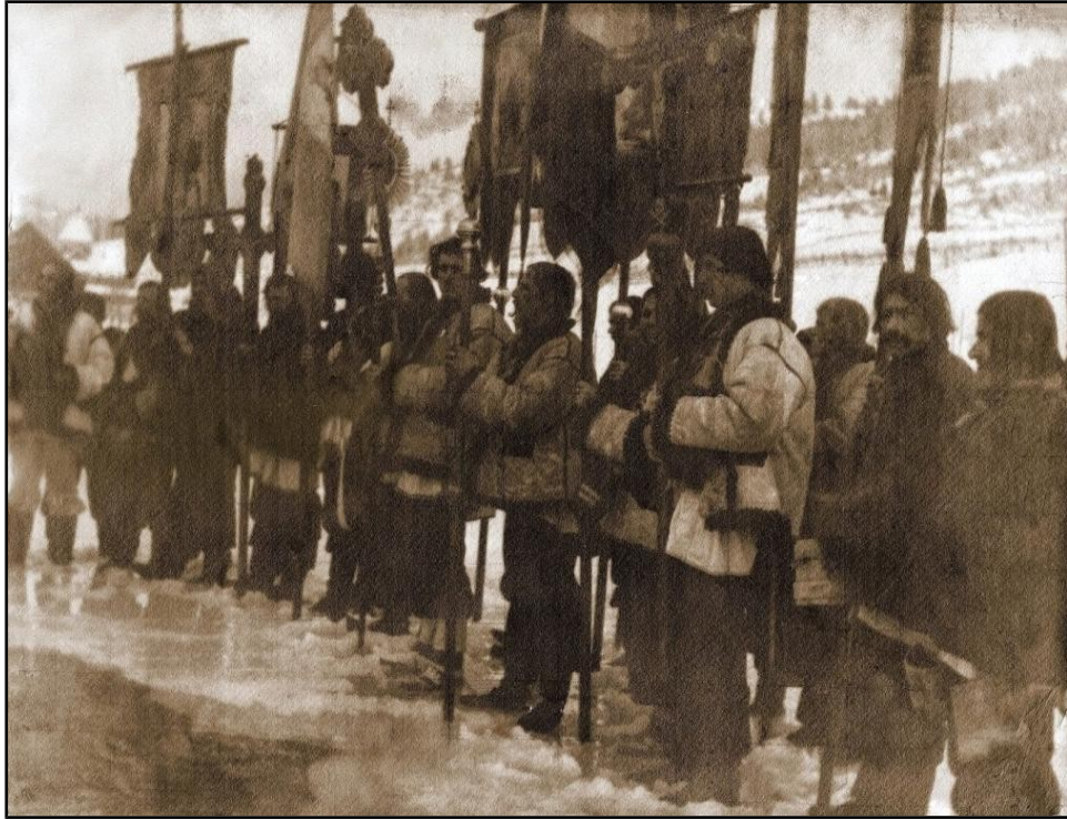
13) Procesiune de sfințire a apei de Bobotează la huțuli , reproducere după Władysław Jarocki, pictor polonez, cca 1900.