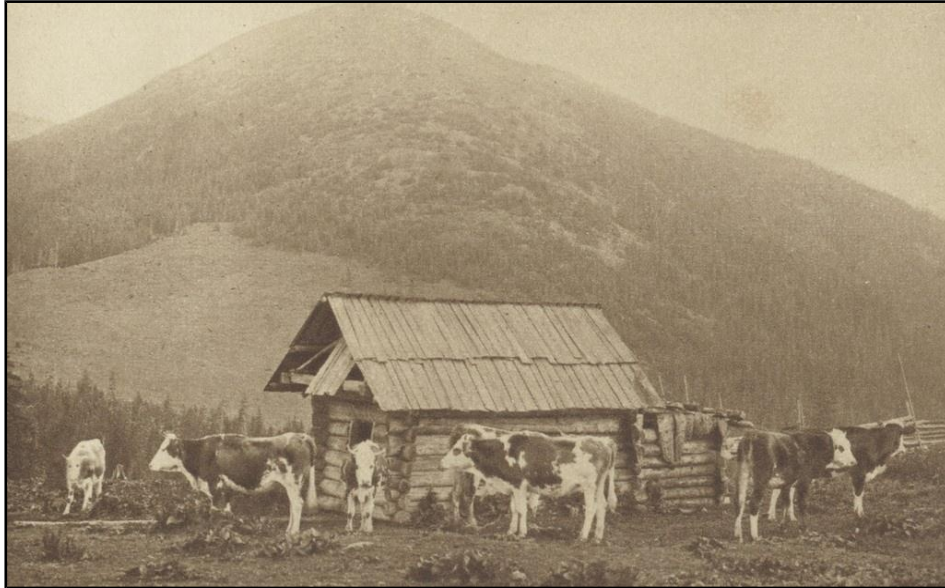
8) Văcărie în Plonina/pe plai , fotografie de epocă, ante 1900.