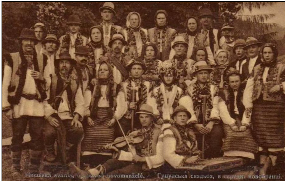
Нічуйська свадьба, у середі новоманжеле. Гуцульська свадьба, в середі новобранці.