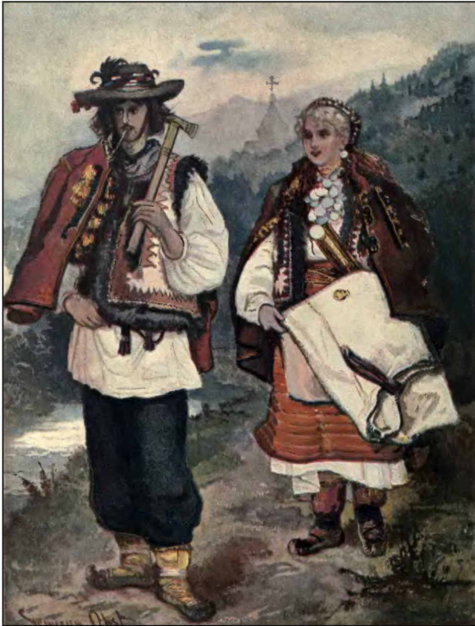
15) Pereche de huțuli tineri , acuarelă de Seweryn Obst, pictor polonez, 1902.