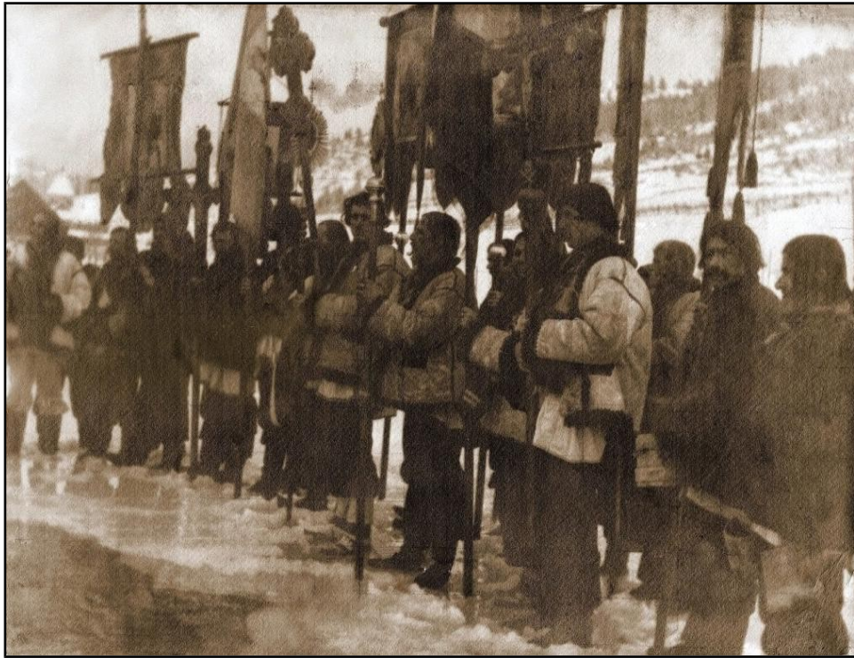
13) Procesiune de sfințire a apei de Bobotează la huțuli , reproducere după Władysław Jarocki, pictor polonez, cca 1900.