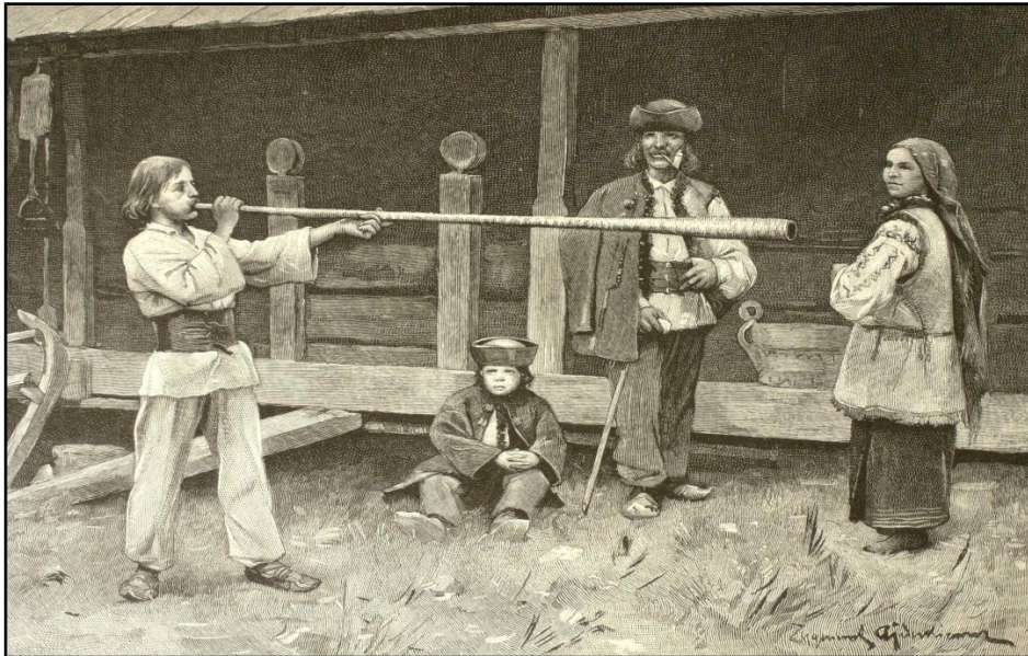
10) Huțuli din Bucovina , heliogravură de Zygmund Ajdukiewicz, 1899.