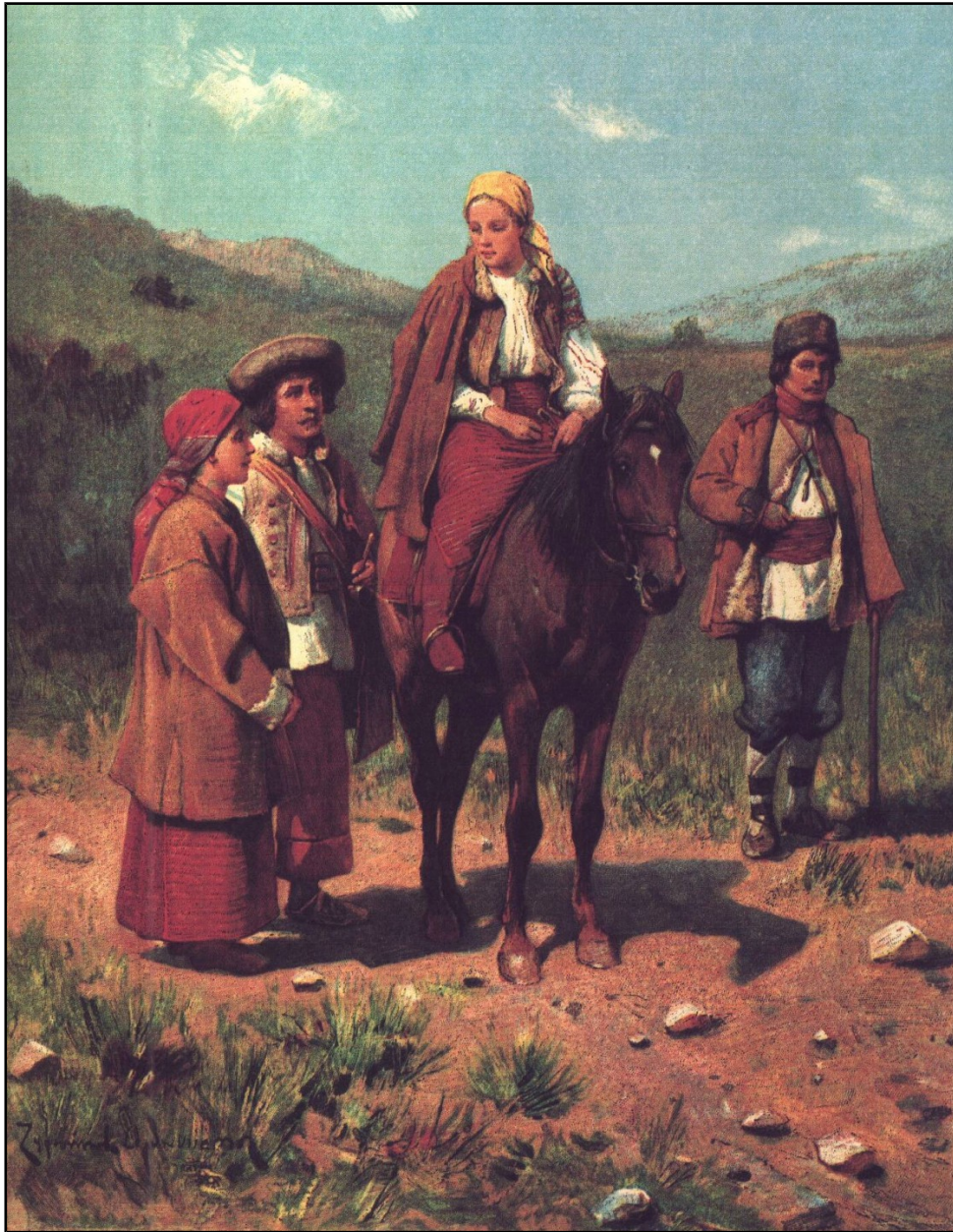
14) Huțuli din Mikuliczyn-Nadworna , cromolithografie de Hermann Baar, realizată după Zygmund Ajdukiewicz, 1900.