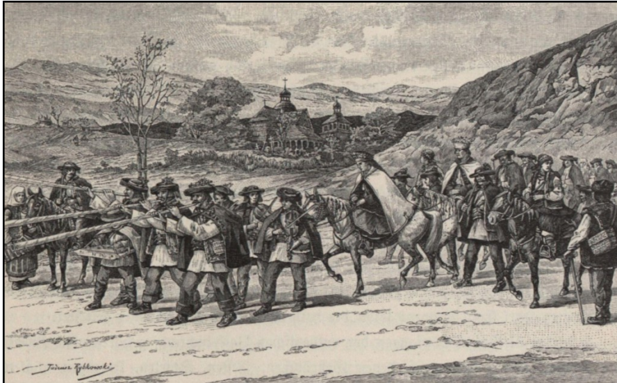
9) Alaiul de nuntă al huțulilor , heliogravură de Tadeusz Rybkowski, 1883.