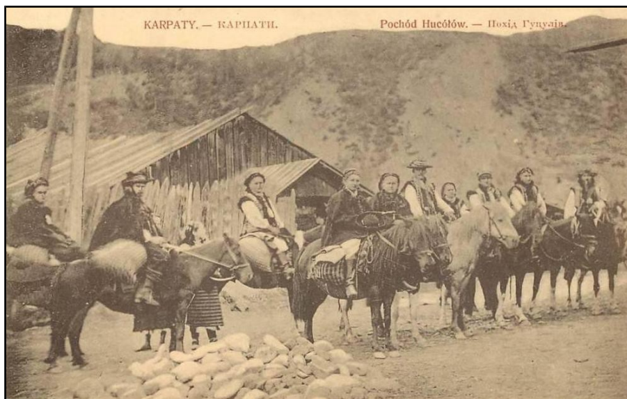
4) Huțuli din Regiunea Subcarpathia , Ilustrată etnografică editată la Praga, cca 1900.