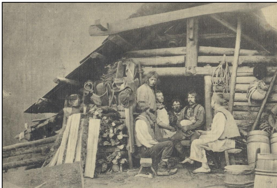
6) Colibă de stână în Hutsulsczyna, veche fotografie de epocă, ante 1900.