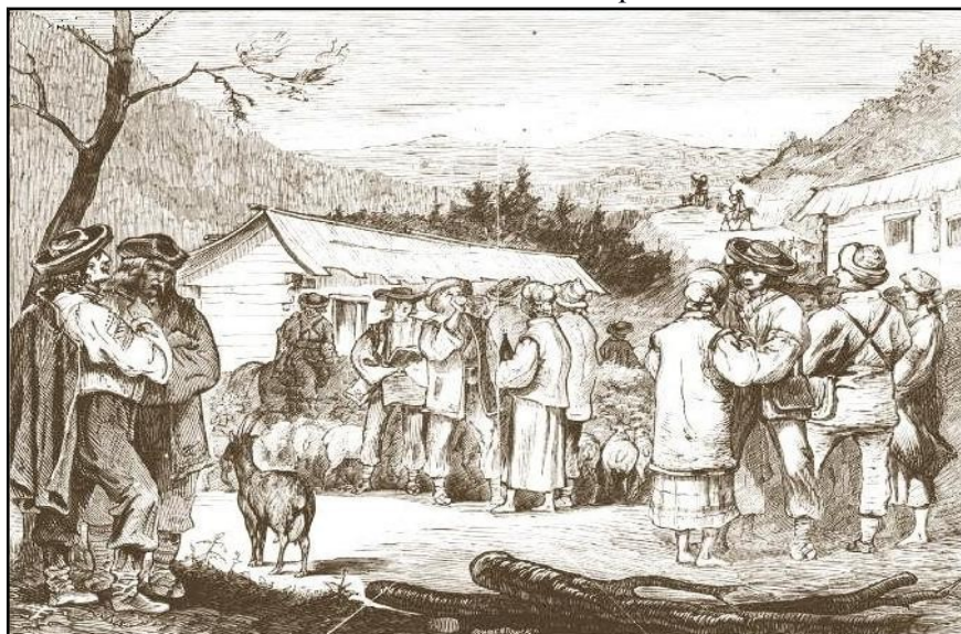
5) Plecarea huțulilor în Plonina/Polonina , desen după natură de Młodnicki, 1872.