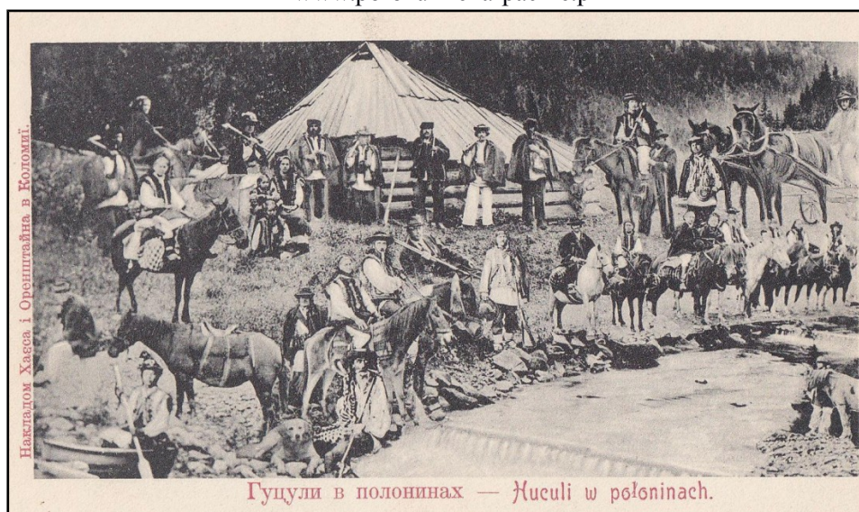
7) Huțuli în polonina/pe plai, ilustrată editată de I. Orenstein din Kolomea, cca 1900.