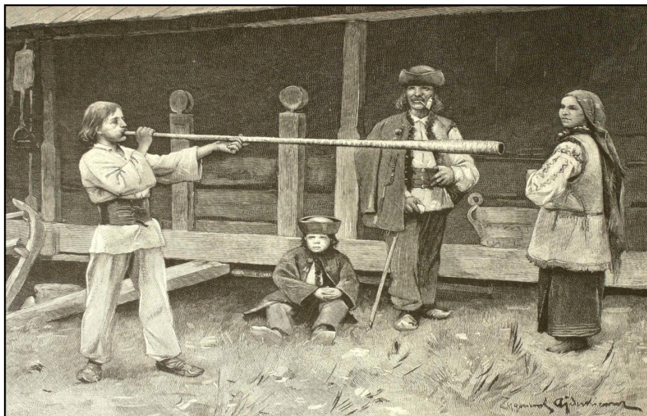
10) Huțuli din Bucovina , heliogravură de Zygmund Ajdukiewicz, 1899.