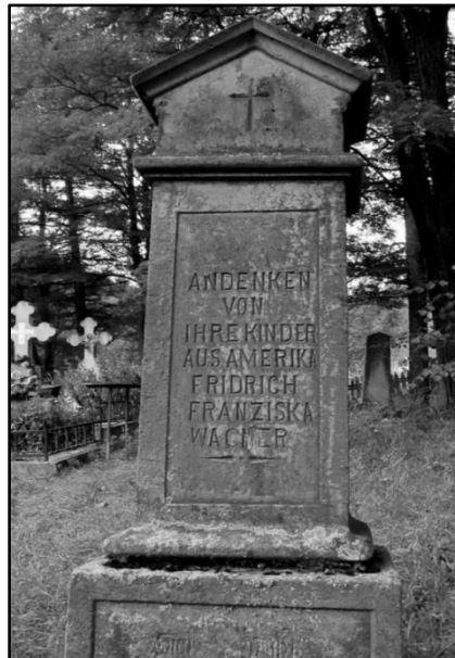
Foto 2. Gedenk-Grabstein. Eisenauer Friedhof

Der Niedergang des Bergbauwesens in diesem südlichen Buchenländer Bergland, der später große Kinderreichtum in dieser Gegend und die allgemeine Wirtschaftslage führten um 1900 auch hier zu Abwanderungen, vor allem über die Berge Richtung Siebenbürgen (vor allem in den Bistritz-Nassoder Raum) mit seinen evangelischen Sachsen, Raum, aus dem seinerzeit Siedler in die evangelischen Zipser-Siedlungen gekommen waren, aber auch nach Nordamerika 19 .