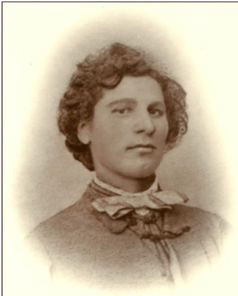
Simion Florea Marian în anul 1868