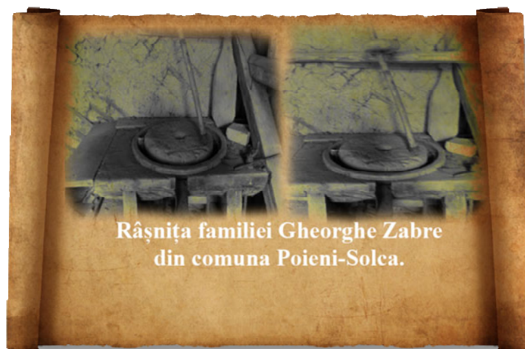
Fig. 1. Râșniță din comuna Poieni-Solca.