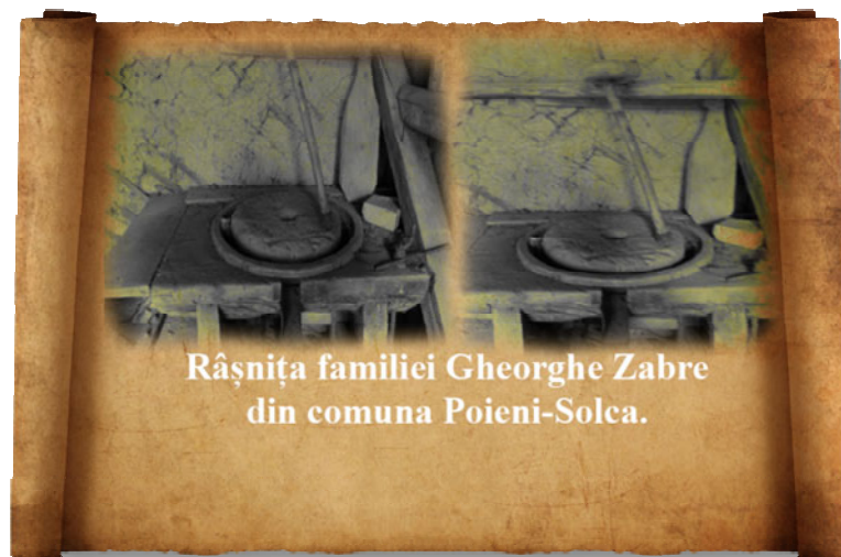
Fig. 1. Râșniță din comuna Poieni-Solca.