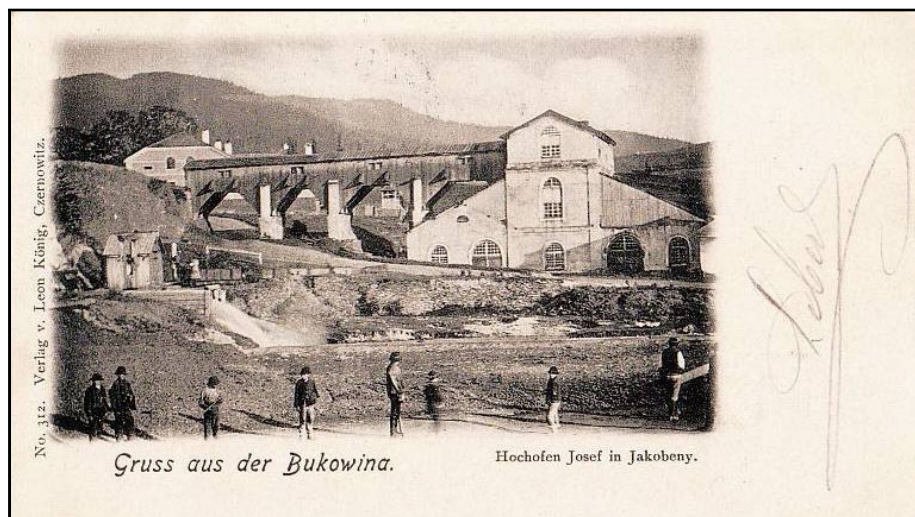
Iacobeni, furnalul „Josef”.