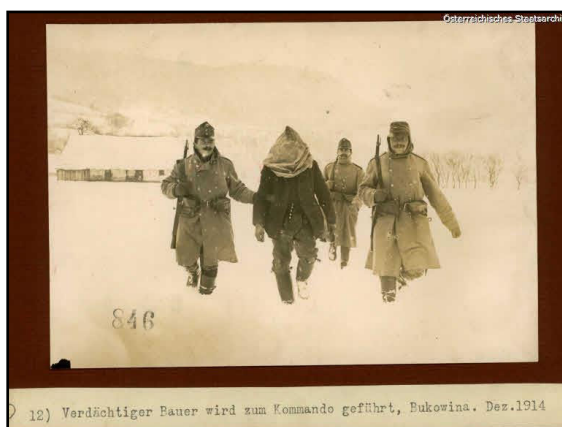
Țăran suspect condus la comandament. Bucovina, decembrie 1914.