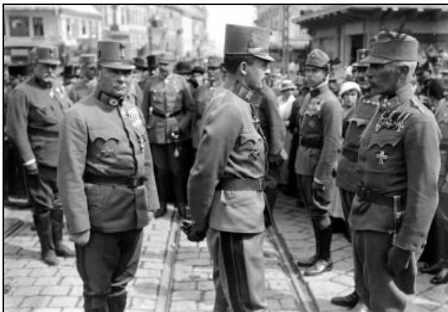
Cernăuți, 1917. Împăratul Carol în piața centrală din Cernăuți vorbind cu generalul Eduard Fischer.