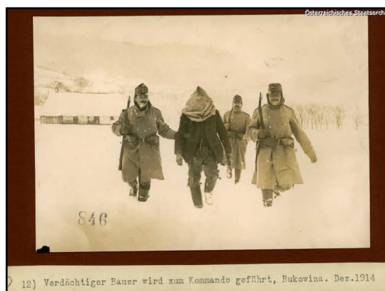
Țăran suspect condus la comandament. Bucovina, decembrie 1914.