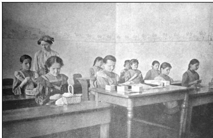
Fig. 4. Cursul de lucru de mână pentru elevele nevăzătoare.