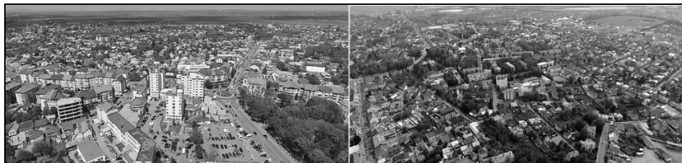
Foto. 7. Rădăuți – vedere panoramică. Stânga: vedere dinspre centru spre nord; dreapta: vedere din vest spre est și sud-est.

În ceea ce privește modul de organizare a locuinței, precizăm că: în partea nordică a orașului predomină casele cu structură tradițională, cu un hol central din care se intră în două până la cinci încăperi, cu bucătăria în interior sau separat, într-o anexă, cu acoperiș din tablă sau, mai rar, șindrilă; casele au curți largi și grădini amplasate lateral sau în spatele gospodăriei. Acest tip de locuințe se mai găsește în zona centrală, unde ele sunt aliniate la trotuarul stradal – curțile fiind poziționate în spatele locuinței –, și pe întreg teritoriul municipiului, unde sunt, în general, retrase de la stradă, având în fața casei grădini cu flori. Casele mai noi se grupează în spațiile rezidențiale din sudul orașului, fiind prezente însă dispersat și în restul teritoriului, au arhitectură modernă, sunt acoperite cu tablă de tip Lindab, au curți pavate, cu regim de înălțime P + 1 sau P + 2, la etaj fiind amplasate, de regulă, dormitoare, parterul fiind structurat în mai multe spații cu utilități diferite: bucătărie, living, camere de zi etc.