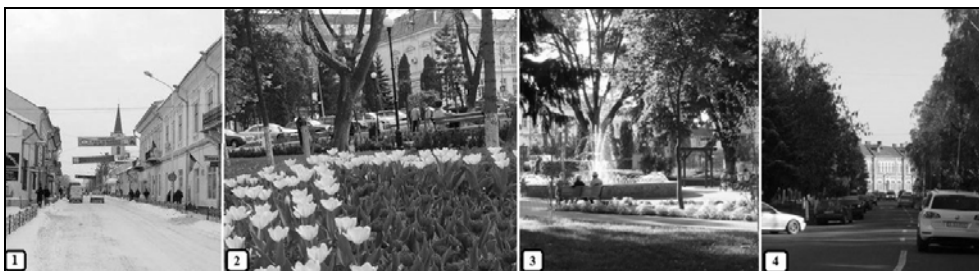
Foto. 3. Rădăuți – peisaje impuse de alternanța anotimpurilor: 1) Peisaj de iarnă pe Str. Ștefan cel Mare; 2, 3) Peisaj de primăvară și de vară în Parcul Primăriei; 4) Peisaj de toamnă pe Calea Bucovinei.

Clima, prin elementele sale, contribuie hotărâtor la modelarea și crearea de peisaje. Implicațiile climatice asupra mediului și peisajului urban sunt numeroase și variate: clima condiționează formarea de topoclimate la nivelul teritoriului, impune specificul învelișului vegetal și de soluri, vegetația fiind un element reper al peisajului; de asemenea, prin succesiunea anotimpurilor, generează diferențieri cu implicații evidente în definirea peisajelor și asupra activității umane.