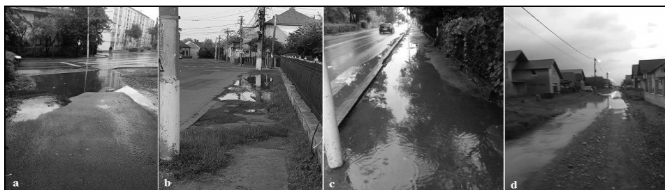
Foto. 1. Rădăuți – influența planeității reliefului asupra drenajului apelor pluviale (a, c – Str. Iacob Zadik; b – Str. Ion Nistor; d – Zona Habitat). Sursa: fotografiile realizate de Luminița Lăzărescu, iulie 2018.

Planeitatea reliefului corelată cu revărsările Topliței și Pozenului au influențat negativ locuirea în Rădăuți până în secolul al XIX-lea: inundațiile alimentau teritoriul mlăștinos ce se întindea în sudul așezării, în mare parte a anului potecile de legătură dintre case deveneau impracticabile, cu precădere toamna și primăvara 12 . Deși în prezent riscul inundațiilor este redus, valea Topliței fiind canalizată, spații întinse din interiorul orașului, în special vara, după ploi, se confruntă cu problema drenajului lent al apei pluviale, aspect ilustrat și în imaginile surprinse de noi (foto. 1).