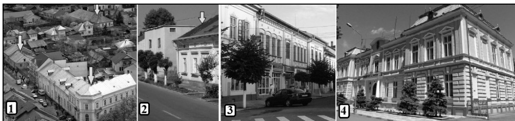
Foto. 4. Rădăuți – clădiri cu specific austriac: 1) Casa Germană; 2) Case pe Calea Cernăuți; 3) Clădiri din centrul istoric; 4) Clădirea Primăriei.

Clima, deși mai rece și mai umedă decât în alte regiuni de podiș din țară, nu a constituit un impediment în valorificarea potențialului natural de către populație. Omul s-a adaptat foarte bine condițiilor de viață de pe teritoriul așezării. Cel mai bine reflectă acest lucru acoperișul caselor, care, pentru a proteja locuința împotriva intemperiilor și a vânturilor, a fost construit în patru ape. Dintre acestea, două sunt late, de formă trapezoidală – și anume, cea din față și cea din spate, care se îmbină la coamă –, iar celelalte două, de la pereții laterali, sunt mai înguste, triunghiulare. Casele cu acoperișul în două ape sunt o inovație alogenă, introdusă pe vremea stăpânirii austriece.