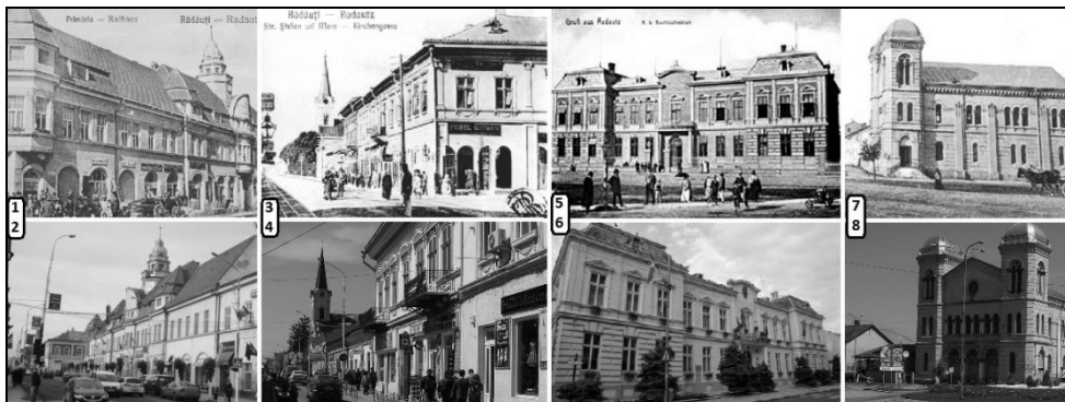
Foto. 5. Rădăuți – zona centrală. Rândul de sus: clădiri istorice datând din sec. XVIII–XIX. Rândul de jos: imagini actuale (1, 2 – centrul localității, cu fosta clădire a Primăriei; 3, 4 – Str. Ștefan cel Mare și Biserica catolică; 5, 6 – clădirea actuală a Primăriei care, în timp, a găzduit: Direcția Hergheleii, Cercul și comandamentul militar, sediul Comitetului raional al P.C.R.; 7, 8 – Templul Evreiesc).

În această perioadă, s-a dezvoltat în mod deosebit fondul locativ al orașului, prin construirea cartierelor de blocuri. În perioada 1965–1975, au fost date în folosință 1 400 de apartamente 37 ; în anul 1977, numărul locuințelor din Rădăuți se ridica la 6 412 (6 470) 38 , iar până în anul 1989 a crescut la 10 362 de locuințe (din care 6 279 în proprietate socialistă) 39 .