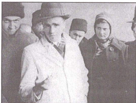
Împreună cu pomicultorii