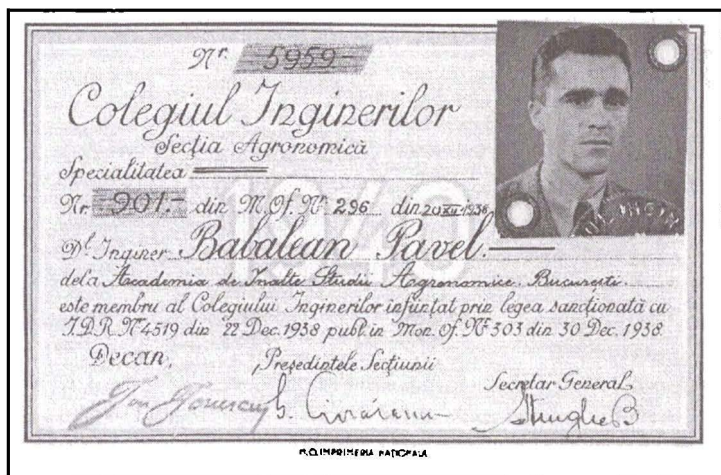
Legitimă de inginer agronom