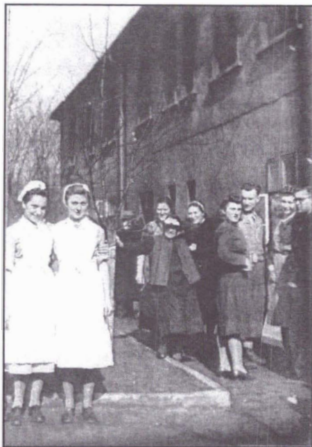
În fața clădirii Mănăstirii-lagăr din Gleiwitz, împreună cu un grup de refugiați din Bucovina și două surori-infirmiere nemțoaice.