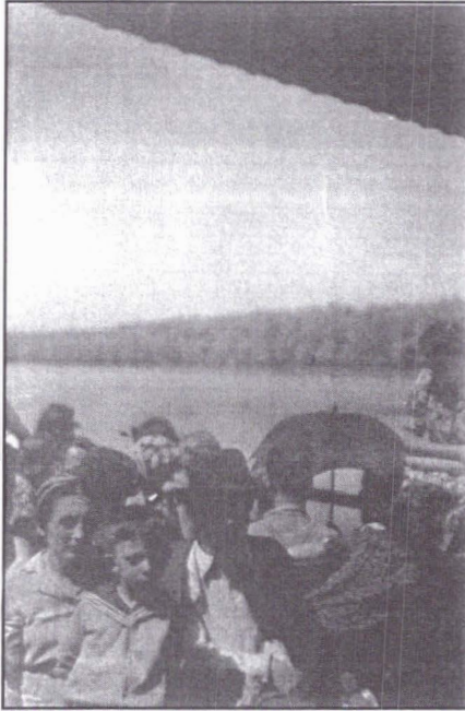
Refugiați din Bucovina, cu vaporul pe Dunăre, în drum spre România, iunie 1941.