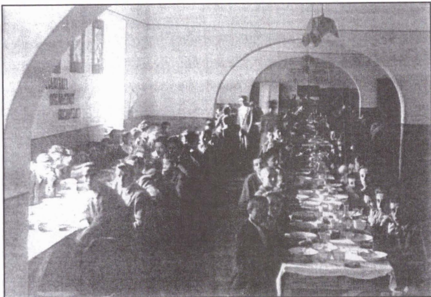
Sărbătorirea Crăciunului la cantina lagărului din Gleiwitz, 25 decembrie 1940.