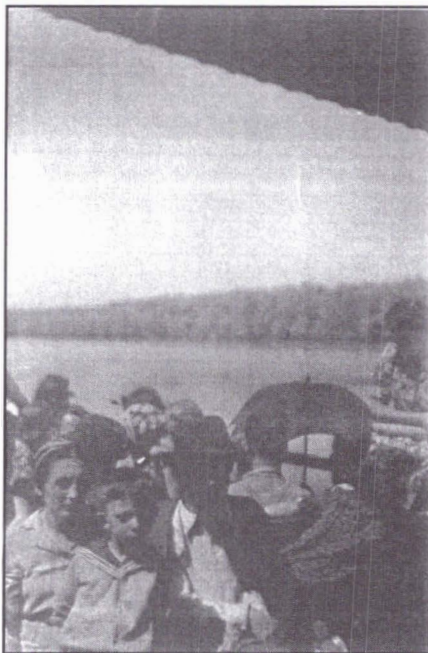
Refugiați din Bucovina, cu vaporul pe Dunăre, în drum spre România, iunie 1941.