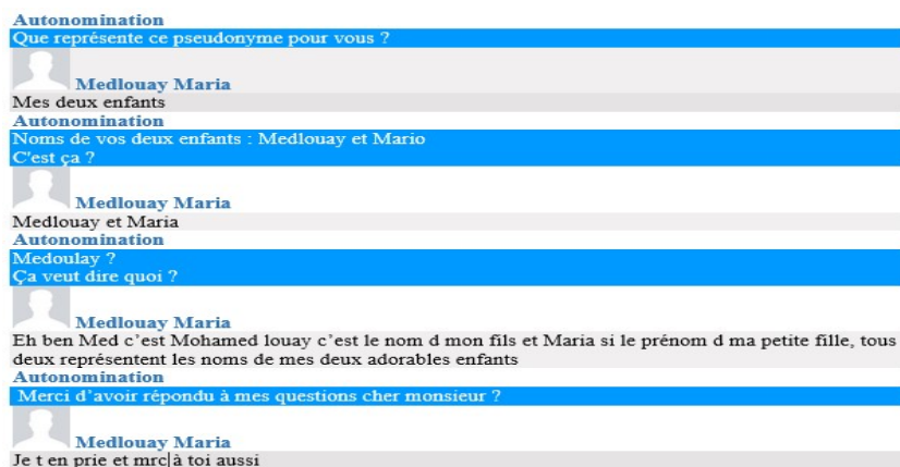
Capture d'écran d'un entretien par messagerie instantané