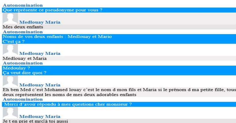
Capture d'écran d'un entretien par messagerie instantané