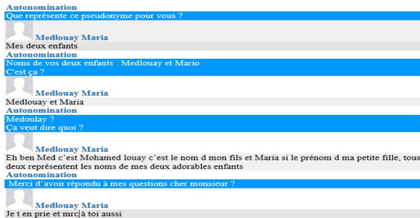
Capture d'écran d'un entretien par messagerie instantané