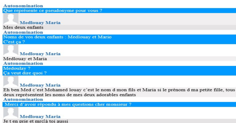
Capture d'écran d'un entretien par messagerie instantané