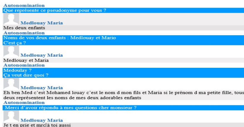
Capture d'écran d'un entretien par messagerie instantané