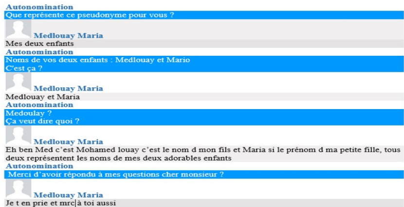
Capture d'écran d'un entretien par messagerie instantané