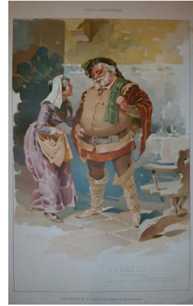
Cartolina illustrata del Falstaff di Verdi

Per il Manifesto di Tosca Hohenstein sceglie di porre in evidenza il culmine del climax della vicenda, la morte di Scarpia, che è un'immagine piena di pathos che si percepisce ancor più grande grazie anche al contrasto evidente di luci ed ombre.