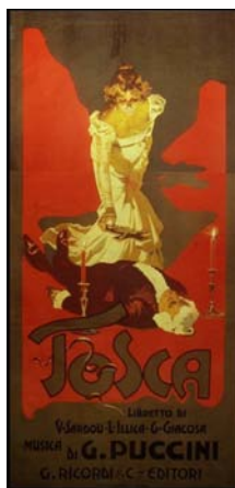
Cartellone per la Tosca-Roma-14 gennaio 1900