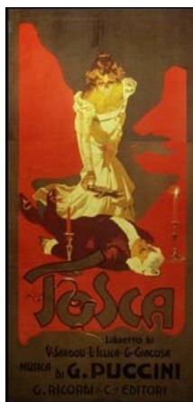
Cartellone per la Tosca-Roma-14 gennaio 1900