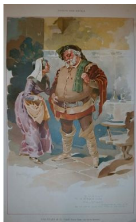
Cartolina illustrata del Falstaff di Verdi

Per il Manifesto di Tosca Hohenstein sceglie di porre in evidenza il culmine del climax della vicenda, la morte di Scarpia, che è un'immagine piena di pathos che si percepisce ancor più grande grazie anche al contrasto evidente di luci ed ombre.