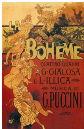
Manifesto della prima del 1896