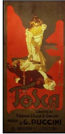
Cartellone per la Tosca-Roma-14 gennaio 1900