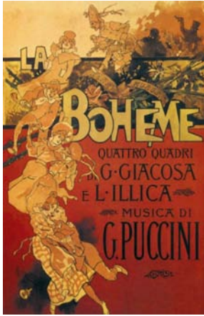
Manifesto della prima del 1896