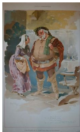
Cartolina illustrata del Falstaff di Verdi

Per il Manifesto di Tosca Hohenstein sceglie di porre in evidenza il culmine del climax della vicenda, la morte di Scarpia, che è un'immagine piena di pathos che si percepisce ancor più grande grazie anche al contrasto evidente di luci ed ombre.