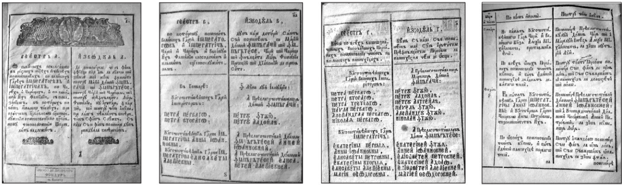
Figura 1. Рестр поминовения великих императоров и императриц (Izvodul de pomenire pentru marii domni, împărați și împărătese). Chișinău, Tipografia duhovnicească, 1859.

text) constituie mostre de stil administrativ/prescriptiv bisericesc din secolul al XIX-lea. În totalitatea sa, textul demonstrează modul în care trebuia să se facă îndochinarea maselor, să se inoculezie istoria, tradițiile și valorile culturale ale cuceritorului.