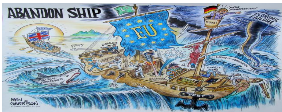
Fig. 5.

Interesant de semnalat este modul în care, în discursul public britanic, izotopia dezastrului de natură lichidă este excelent ilustrată într-o caricatură consacrată în spațiul media virtual. Aceasta activează scenariul favorabil procesului Brexit pe baza unei metafore multimodale, construită la intersecția dintre nivelul iconic (barca de salvare cu steagul Marii Britanii care se îndepărtează de nava Uniunii Europene, în proces de scufundare, cu cancelarul Angela Merkel la cârmă) și verbal (prin mesajul cu majuscule boldate ce focalizează atenția: „Abandonați barca!”). La același nivel, remarcăm inserții lingvistice semnificative: cufărul cu taxe, ancora datoriilor, problema eurozonei din subsolul navei, „valurile de imigranți”, „rechinii corectitudinii politice”, „tsunamiul financiar la orizont”.