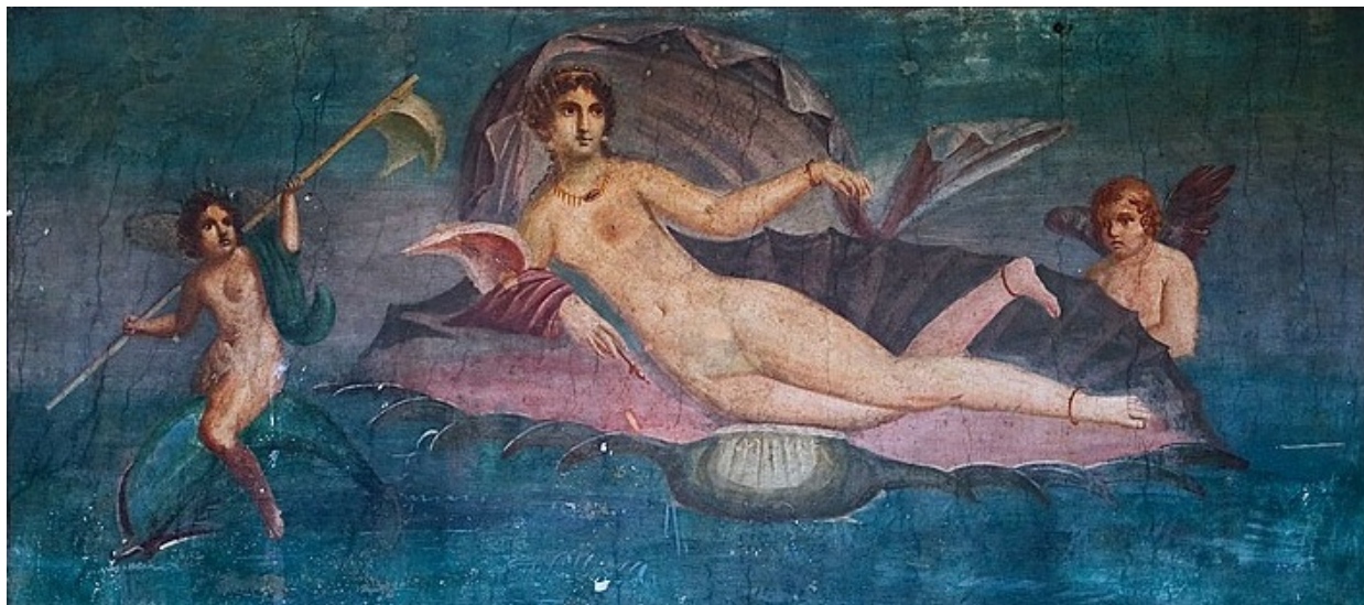
Fig. 1. Afrodita Anadyomene din Pompei (frescă, sec. I e.n.)