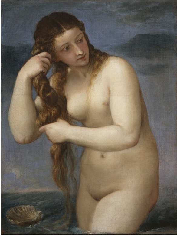
Fig. 5. Tiziano Vecellio, Venus înălțându-se din mare (1520)