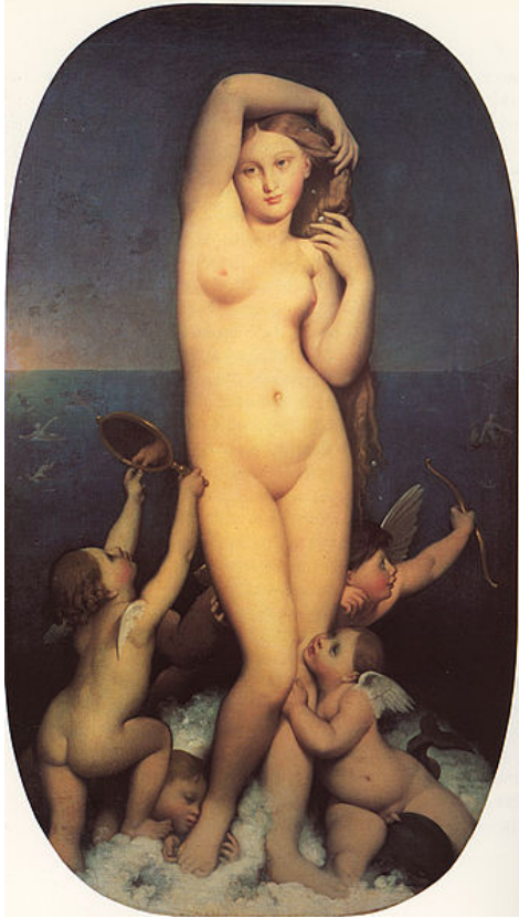
Fig. 9. Jean Auguste Dominique Ingres, Venus Anadyomene (între anii 1808-1848)