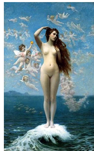
Fig. 12. Jean-Léon Gérôme, Nașterea lui Venus (1890)