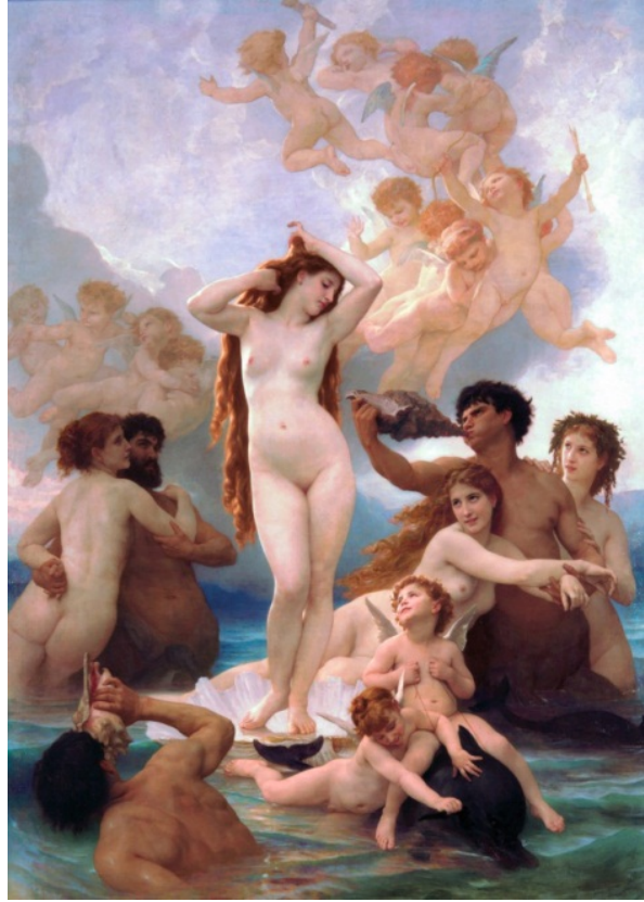
Fig. 10. William-Adolphe Bouguereau, Nașterea lui Venus (1879)