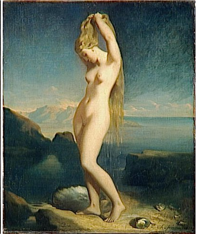
Fig. 6. Théodore Chassériau, Venus Anadyomene (1838)