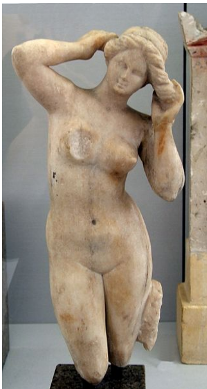
Fig. 2. Anadyomene (sec. II-I î.e.n.)