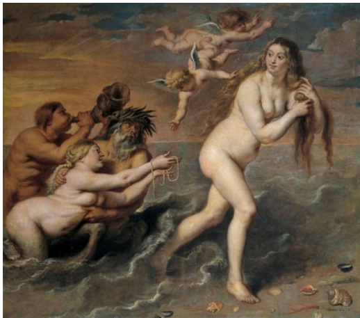
Fig. 7. Cornelis de Vos, Nașterea lui Venus (sec. XVII)