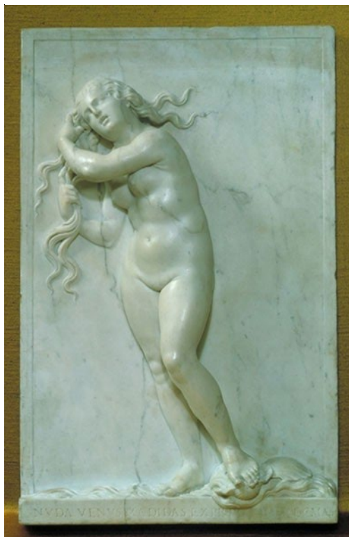
Fig. 4. Antonio Lombardo, Venus Anadyomene (1571-1572) Anadyomene (1480-1516)