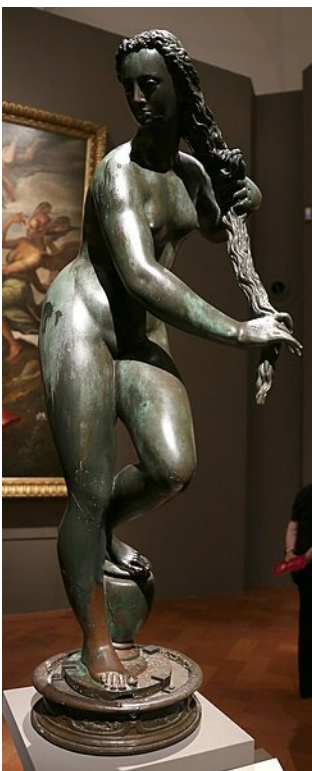
Fig. 3. Giambologna, Venus