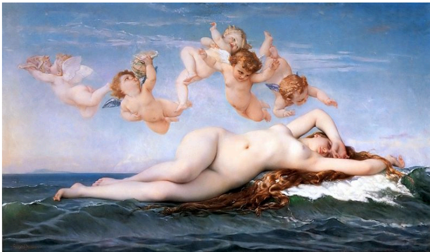
Fig. 11. Alexandre Cabanel, Nașterea lui Venus (1875)