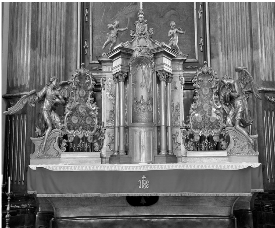
Foto 3. J. J. Resler, tabernacol, Domul catolic, Timișoara, 1754 (apud Arhiva Diecezană Romano-catolică din Timișoara, fond Arh. M. Botescu)

încununată de capiteluri corintice, surmontat de antablament, coloanele separând trei registre decorate în tehnica basoreliefului cu scene biblice, dintre care, autorul a ales trei scene cu impact emoțional pentru decorul părții centrale: Împărțășania apostolilor, dreapta: Sfântul Christofor cu Isus pe umăr , stânga: Jertfa lui Avraam , reprezentări la care sugerarea perspectivă s-a făcut prin plasarea în fundal a unor elemente din natură sau o draperie cu falduri ample în nișa centrală. Ediculul este flancat de două cartușe decorative ce conțin numele celor patru virtuți cardinale și patru teologale, iar de-o parte și de cealaltă statuile celor doi heruvimi adoratori așezați pe console decorate cu motivul grătarului și rocaille -uri, lucrări ce aparțin sculptorului J. J. Resler, fără a fi semnate, fiind atribuite pe baza analogiilor stilistice, a eleganței și rafinamentului plastic, prezent la toate creațiile autorului amintit. Aceste realizări se înscriu în seria de lucrări elaborate pe tot cuprinsul imperiului, dovedind principii modelatoare diferite, aparținând din punct de vedere stilistic, barocului târziu clasicizant cu accente rococo. Fizionomiile celor doi heruvimi sunt studiate, pătrunse de sentimentul religios, observându-se și o grijă deosebită pentru detaliu (redarea minuțioasă a penajului aripilor).