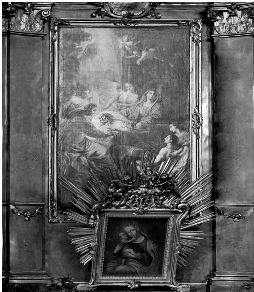
Foto 5. J. N. Schöpf, Moartea Sf. Iosif, altar lateral Domul Catolic, Timișoara, 1772