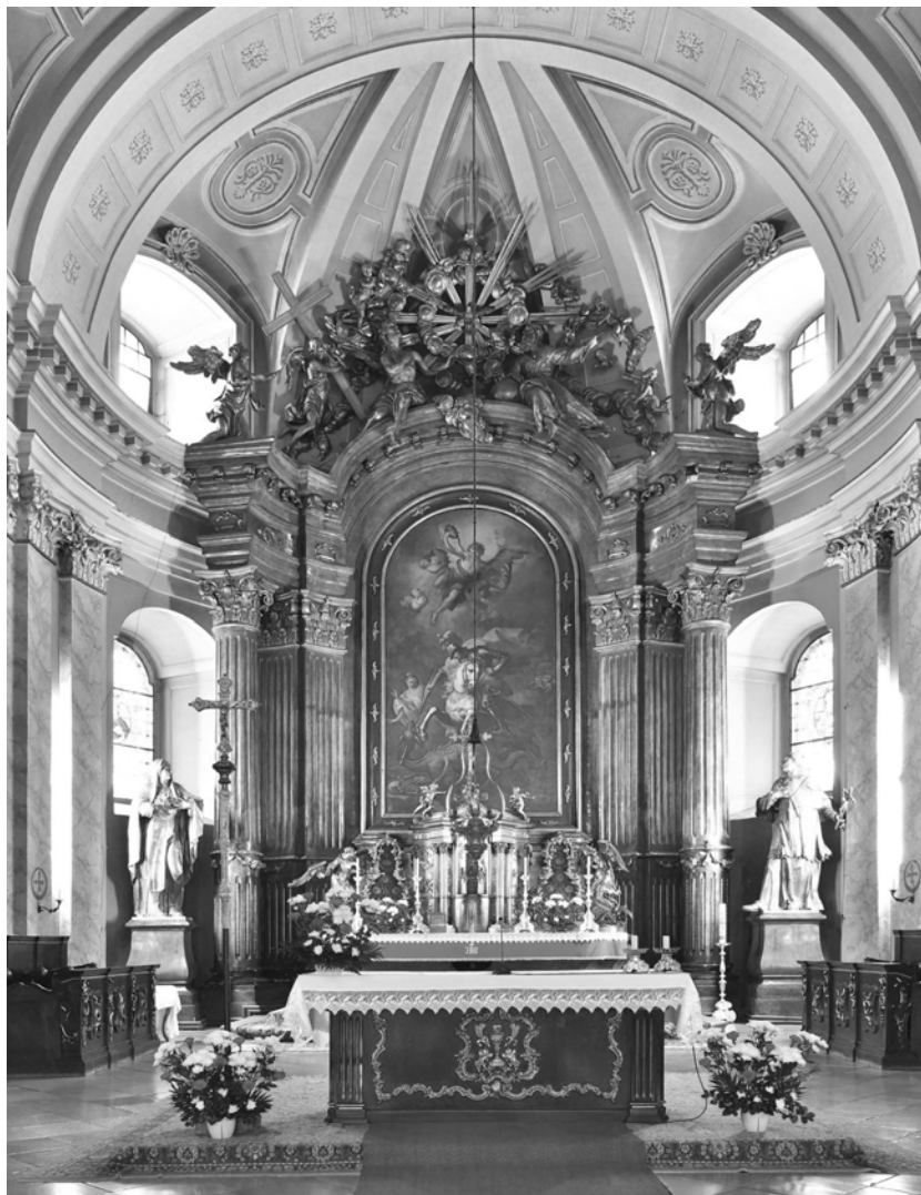
Foto 1. Altarul principal al Domului, Timișoara

numit de către Maria Tereza: Rector magnificus în 1751. În această calitate îl întâlnim în peisajul bănățean, în 1754 când execută pentru același comanditar oficial tabloul votiv al altarului principal al domului catolic cu tema Sf. Gheorghe ucigând balaurul . M. Unterberger fiind prezent în calitate de pictor academic și la Târgu Mureș unde realizează compoziția altarului principal al bisericii iezuite, cu o compoziție spațială, specifică repertoriului său european, menționând în acest sens compoziția realizată pentru biserica din Stotzing între 1743-1751 (Vârtaciu 2016, 220) sau la biserica ordinului piarist din Kromeritz. (foto 2).