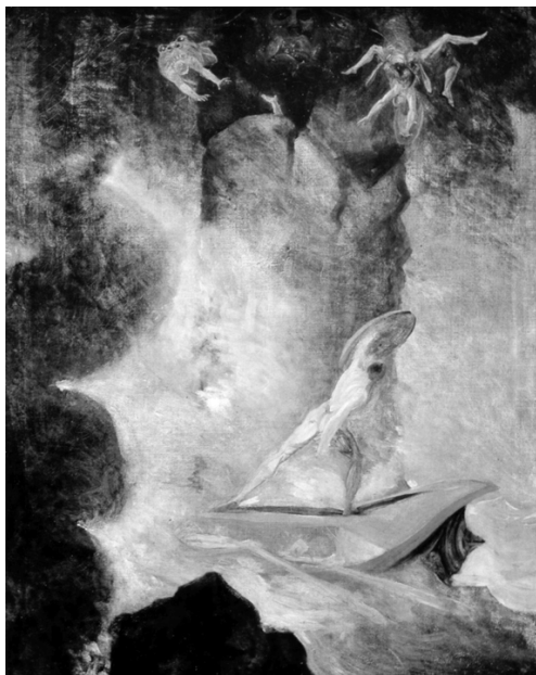
Henry Fuseli, Ulise în fața Scilei și Caribdei , 1794-1796

îndoitului pericol: venit medio vi pontus et undis/Hesperium Siculo latus abscondit, arvaque et urbes/ Litore diductas angusto interluit aestu./ Dextrum Scylla latus, laevum implacata Charybdis/Obsidet, atque imo barathri ter gurgite vastos/ Sorbet in abruptum fluctus rursusque sub auras/ Erigit alternos, et sidera verberat unda./ At Scyllam caecis cohibet spelunca latebris/ Ora exsertantem et navis in saxa trahentem./ Prima hominis facies et pulchro pectore virgo/ Pube tenus, postrema immani corpore pistrinx/ Delphinum caudas utero commissa luporum./ Praestat Trinacrii metas lustrare Pachyni/ Cessantem, longos et circumflectere cursus./ Quam semel informem vasto vidisse sub antro/ Scyllam et caeruleis canibus resonantia saxa (Aen., III, 417-432) „Dup-aceea marea,/ La mijloc pătrunzând cu-a ei talazuri,/ A despărțit cu sila două țarmuri/ Și-a dezbinat Sicilia de Hesperia./ De-