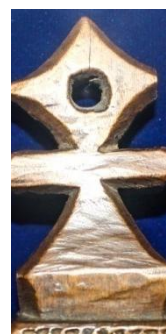
Foto 8: Romb stilizat pe pecetar antropomorf, Colecția Muzeului de Etnografie din Sighetu Marmăției, Maramureșul Voievodal, 2019.