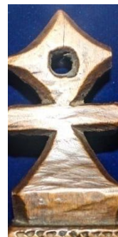
Foto 8: Romb stilizat pe pecetar antropomorf, Colecția Muzeului de Etnografie din Sighetu Marmăției, Maramureșul Voievodal, 2019.