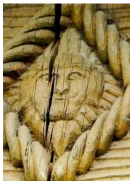
Foto 3: Simbol antropomorf inserat în romb, Hoteni – Țara Maramureșului, 2019.