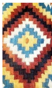
Foto 13: Detaliu pe țol/covor. Romb în trepte, Colecția Muzeului de Etnografie din Sighetu Marmației, Maramureșul Voievodal, 2019.