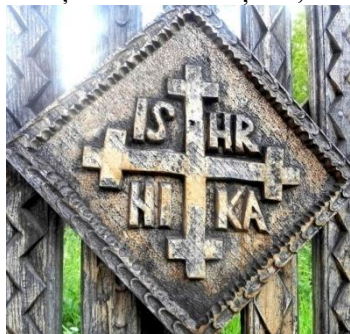
Foto 7: Romb cu simboluri sacre, Breb – Țara Maramureșului, 2019.