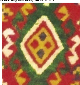
Foto 14: Detaliu pe țol/covor. Romb cu coarne Colecția Muzeului de Etnografie din de la Ieud, Maramureșul Voievodal, 2019.