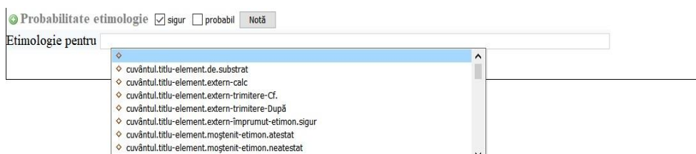
Fig. 3. Secțiunea etimologie pentru cuvântul-titlu.

De asemenea, s-a avut în vedere caracterul facultativ al anumitor componente. Dacă etimologia cuvântului-titlu este obligatorie (prezentă în finalul primului ecran al interfeței), etimologia sensurilor se impune numai în anumite situații. Din acest motiv, s-a ales implementarea unui sistem de butoane care să activeze, după specificul fiecărei redactări, componentele respective.