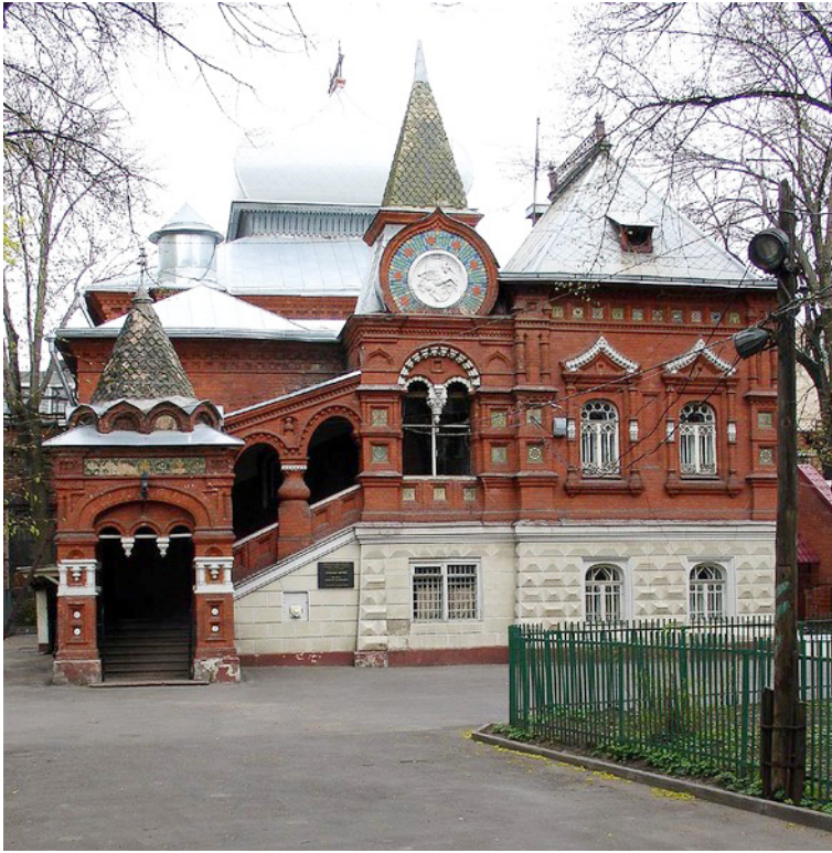
Abb. 1 Ehemaliges Schtschukin-Museum ‚Altbau‘ in Moskau

Rilke und Lou Andreas-Salomé waren bei dieser Reise zwar vor allem an russischer Kunst interessiert, aber diese bildete nicht allein die Sammlung dieses Museums. 40 Es war als privates Museum erbaut und stellte russische Altertümer, Kunstgewerbe und Bilder aus. Besitzer solcher Sammlungen waren zwei Brüder: