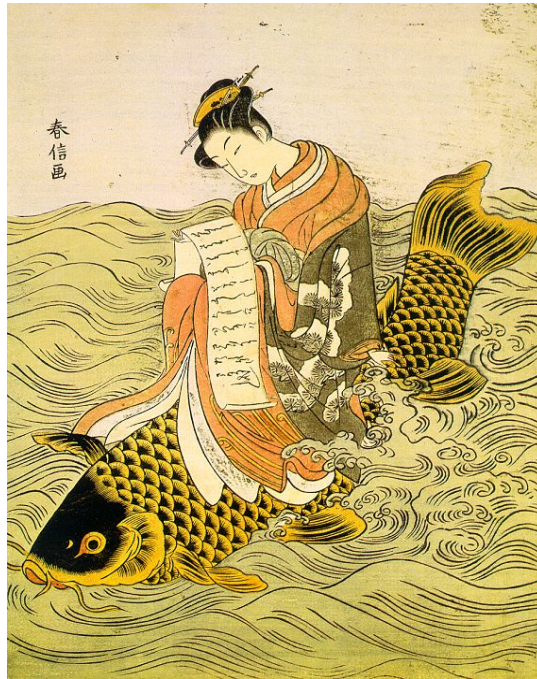
Abbildung 5 Suzuki Harunobu: Mitateno Kinkô, Farbholzschnitt

Eine bekannte Version ist ein kolorierter Holzschnitt (1765) 60 von Suzuki Harunobu (1724 – 1770). Hier sitzt eine Kurtisane der Meiwa-Zeit (Schaffenszeit von Harunobu) auf einem riesigen Karpfen und liest in einem Liebesbrief. 61 Die Farben variieren in den Drucken. Schon damals war die Szene eine Parodie auf einen im Taoismus Unsterblichen, Kinkô Sennin. Dieser chinesische Maler und Musiker der Zhou-Periode (1122 – 247 v. C.) mit dem Namen Qin Gao tauchte der Legende nach aus dem Wasser auf, ritt auf einem riesenhaften Karpfen und trug eine Schriftrolle mit einem Sutra-Text und einem Gesetz, das den Fischfang untersagte. Die frivole Interpretation dieses klassischen Themas in einem aktuellen Kontext ist typisch für die Mitate-e-Drucke (Travestiebilder) des 18. Jahrhunderts. Rilke kannte Harunobu-Drucke, wie er sich später erinnerte. 62