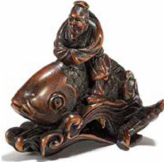
Abbildung 8 Sennin Kinko auf großem Karpfen, Buchsbaum

Zahlreiche Darstellungen dieser Szene finden sich bei den geschnitzten japanischen Miniaturen (Netsuke):