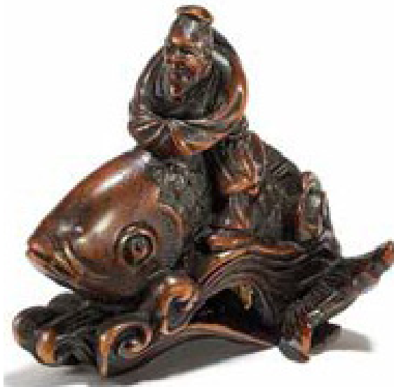
Abbildung 8 Sennin Kinko auf großem Karpfen, Buchsbaum

Zahlreiche Darstellungen dieser Szene finden sich bei den geschnitzten japanischen Miniaturen (Netsuke):