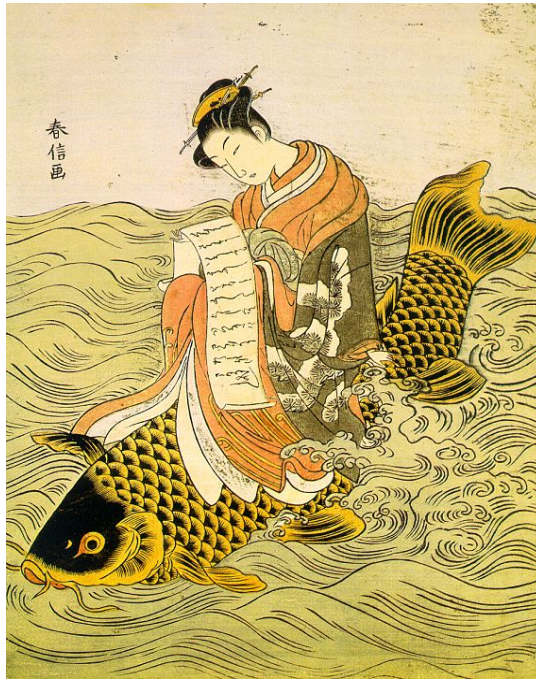
Abbildung 5 Suzuki Harunobu: Mitateno Kinkô, Farbholzschnitt

Eine bekannte Version ist ein kolorierter Holzschnitt (1765) 60 von Suzuki Harunobu (1724 – 1770). Hier sitzt eine Kurtisane der Meiwa-Zeit (Schaffenszeit von Harunobu) auf einem riesigen Karpfen und liest in einem Liebesbrief. 61 Die Farben variieren in den Drucken. Schon damals war die Szene eine Parodie auf einen im Taoismus Unsterblichen, Kinkô Sennin. Dieser chinesische Maler und Musiker der Zhou-Periode (1122 – 247 v. C.) mit dem Namen Qin Gao tauchte der Legende nach aus dem Wasser auf, ritt auf einem riesenhaften Karpfen und trug eine Schriftrolle mit einem Sutra-Text und einem Gesetz, das den Fischfang untersagte. Die frivole Interpretation dieses klassischen Themas in einem aktuellen Kontext ist typisch für die Mitate-e-Drucke (Travestiebilder) des 18. Jahrhunderts. Rilke kannte Harunobu-Drucke, wie er sich später erinnerte. 62