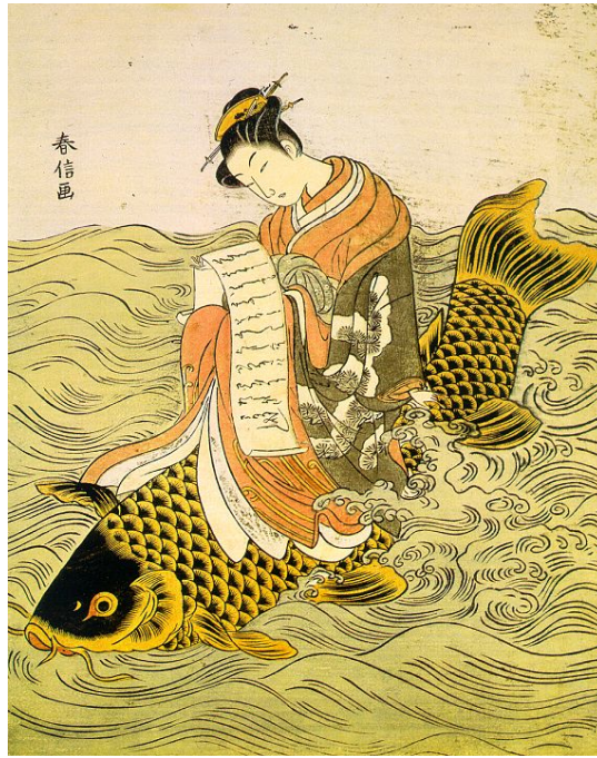
Abbildung 5 Suzuki Harunobu: Mitateno Kinkô, Farbholzschnitt

Eine bekannte Version ist ein kolorierter Holzschnitt (1765) 60 von Suzuki Harunobu (1724 – 1770). Hier sitzt eine Kurtisane der Meiwa-Zeit (Schaffenszeit von Harunobu) auf einem riesigen Karpfen und liest in einem Liebesbrief. 61 Die Farben variieren in den Drucken. Schon damals war die Szene eine Parodie auf einen im Taoismus Unsterblichen, Kinkô Sennin. Dieser chinesische Maler und Musiker der Zhou-Periode (1122 – 247 v. C.) mit dem Namen Qin Gao tauchte der Legende nach aus dem Wasser auf, ritt auf einem riesenhaften Karpfen und trug eine Schriftrolle mit einem Sutra-Text und einem Gesetz, das den Fischfang untersagte. Die frivole Interpretation dieses klassischen Themas in einem aktuellen Kontext ist typisch für die Mitate-e-Drucke (Travestiebilder) des 18. Jahrhunderts. Rilke kannte Harunobu-Drucke, wie er sich später erinnerte. 62