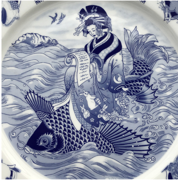
Abbildung 7 Pat Crowell: Porzellanteller im japanischen Stil (2018)

Dargestellt ist auch hier eine Kurtisane, die auf einem Karpfen reitet. In ihr Gewand ist das Bild des Mondhasen eingestickt. In der chinesischen und japanischen Mythologie ist der Hase im Mond (Tsukino Usagi) dabei, in einem Stampfbottich ein Elixier der Unsterblichkeit zu bereiten.