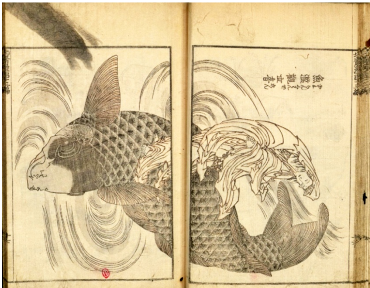
Abb. 3 Katsushika Hokusai: Manga

In Europa wurde Gyoran Kannon vor allem durch einen Holzschnitt von Hokusai bekannt, der 1849 im 13. Band der Mangwa abgebildet wurde. Bedeutsamer wurde aus diesem Bild die Darstellung des Karpfen (Koi), die durch die das Motiv aufnehmende Glas-Vase La carpe , die bei der Weltausstellung (1879) von Émile Gallé präsentiert wurde und im Kunstgewerbe zahlreiche Nachahmung fand.