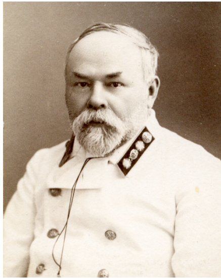
Abb. 2 Pjotr Iwanowitsch Schtschukin

Sein Bruder Pjotr Iwanowitsch Schtschukin (1853 – 1912) sammelte russische Altertümer und auch asiatische Kunst und ließ 1892 – 1893 dafür im Bezirk Lesser Gruziny vom Wiener Architekten Bernhard Freudenberg ein Museumsgebäude (Altbau) errichten. 42 1905 schenkte Schtschukin seine Sammlungen dem Staatlichen Historischen Museum und erarbeitete den Katalog 43 seiner Kunstobjekte. Es ist sicher, dass Rilke die Sammlung dieses Bruders gesehen hat. 44