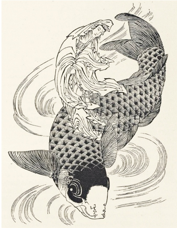
Abb. 4 Französische Grafik nach Hokusai: Kouanon. La Déesse de la Grâce