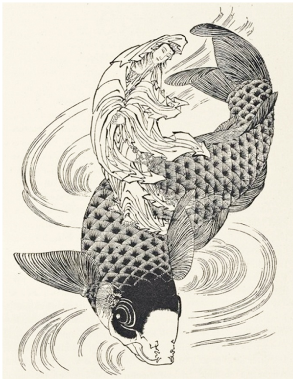
Abb. 4 Französische Grafik nach Hokusai: Kouanon. La Déesse de la Grâce