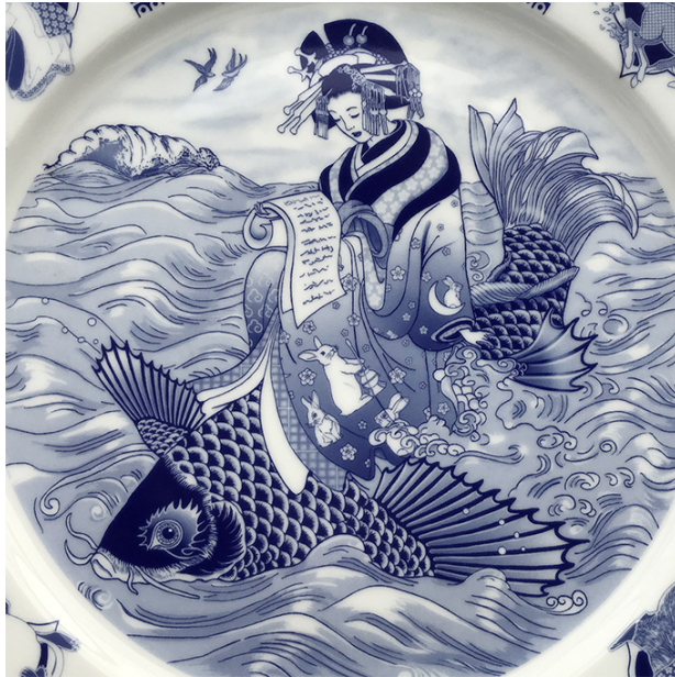
Abbildung 7 Pat Crowell: Porzellanteller im japanischen Stil (2018)

Dargestellt ist auch hier eine Kurtisane, die auf einem Karpfen reitet. In ihr Gewand ist das Bild des Mondhasen eingestickt. In der chinesischen und japanischen Mythologie ist der Hase im Mond (Tsukino Usagi) dabei, in einem Stampfbottich ein Elixier der Unsterblichkeit zu bereiten.