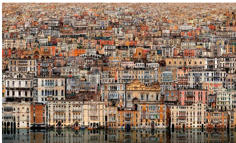
Fig. 8. Jean-Francois Rauzier, Venice Veduta , https://www.rauzier-hyperphoto.com/en/project-type/creations/

Decupată într-un hiper-timp, prezent și continuu, hiperfotografia este concomitent referința și „geamăul său”, dublul, punctul de „disociere întortocheată a conștiinței identității” și „începutul existenței mele ca altul” (Barthes 2010: 18).