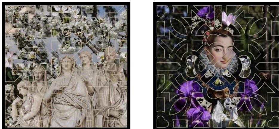
Fig. 4. Ileana Florescu, Le stanze del Giardino , Villa Medici, Roma, 2018

Contrar definiției date de Barthes, care susține că „o fotografie oarecare, în fapt, nu se distinge niciodată de referentul ei (de ceea ce reprezintă)” (Barthes 2010: 81), hiperfotografiile construiesc un referent îndepărtat.