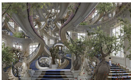
Fig. 7. Jean-Francois Rauzier, Babylons , https://www.rauzier-hyperphoto.com/en/project-type/creations/

Trompe-l'oeil -ul hiperfotografiei rescrie o nouă raportare la timp. Punctum hiperfotografiei, rămâne deictic, însă, în raport cu un timp absolut, cu un timp delegat într-o circularitate hermetică. „Zeul nu cunoaște granițe spațiale și poate să fie, în diferite forme, în locuri diferite în același moment”, nota Umberto Eco despre hermetism (Eco 2016: 42). Analog, referința hiperfotografiei, derivată în trompe-l'oeil , intensifică, nu numai imaginea, ci și raportul cu timpul. ‘Această–lucru-a–existat–cândva’, intensificat, duplicat infinit în „geamănul fantomatic”, trimite la un timp redundant, infinit, spațiat, un fel de „diferență” continuă, care nu mai permite definiția niciunui moment post-factual.