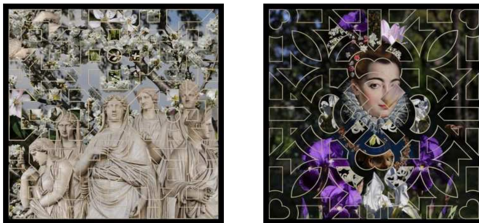
Fig. 4. Ileana Florescu, Le stanze del Giardino , Villa Medici, Roma, 2018

Contrar definiției date de Barthes, care susține că „o fotografie oarecare, în fapt, nu se distinge niciodată de referentul ei (de ceea ce reprezintă)” (Barthes 2010: 81), hiperfotografiile construiesc un referent îndepărtat.