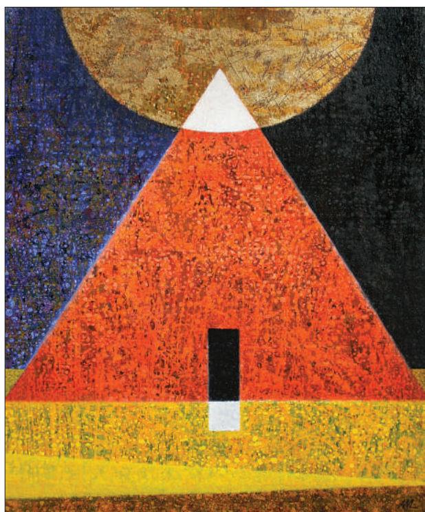
Andrei Mudrea. Noapte Egipteană . 2015, t. a. p. 100 × 80 cm

4) Clasificarea organizațiilor din domeniile cercetării și inovării pe categorii în baza performanței științifice stabilite de ANACEC și aplicarea unor scări tarifare diferențiate de remunerare a personalului științific al acestora (3 categorii de calificare științifică). Scara tarifară actuală ar putea fi utilizată în continuare în raport cu organizațiile de categorie inferioară, iar în raport cu celelalte organizații ar putea fi aplicați coeficienți de creștere salarială pentru performanță (spre exemplu, 1,2 – pentru organizațiile de categoria II și 1,4 – pentru organizațiile de categoria I).