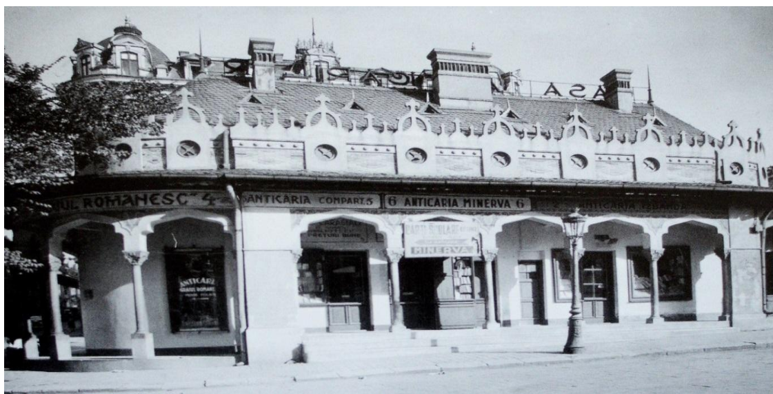
Fig. 2. Casa Anticarilor – vedere laterală 9 .

Toți aceștia și-au păstrat negoțul cu cărți pînă în anul 1948 cînd comerțul a fost preluat de Stat 10 , care doar în decursul aceluși an, a controlat aproximativ 90 de anticariate, printre care Soly Pach de la Casa veche a anticarilor, Azur Mușoiu din Str. Doamnei nr. 1 și Herman Pach de pe Calea Victoriei. (vezi fig. 3).