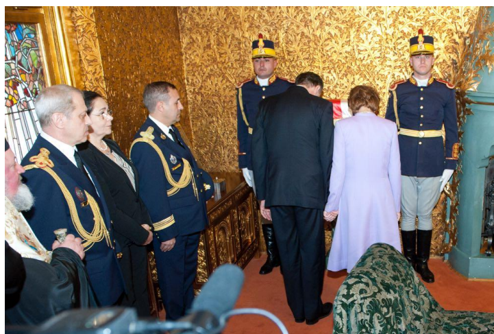
Le cœur de la Reine Marie est déposé au Château Pelișor

Un des moments les plus inattendus de ce parcours artistique personnel a été l'exposition du Château Pelișor, inaugurée le jour même où le cœur de la Reine Marie revenait du Musée National d'Histoire dans la Chambre d'or de ce château splendide que la reine avait tant aimé. Après deux ans pendant lesquels, avec le projet Zestrea , j'avais parcouru des milliers de kilomètres et traversé huit pays européens, me voilà à Siniaia le jour même où on ramenait à la maison le cœur de la reine - on le ramenait là où elle avait rendu l'âme.