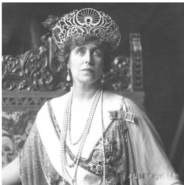
La Reine Marie sur le trône de Roumanie

Même si les grands mérites de la Reine Marie ont été mondialement connus et reconnus de son vivant, la postérité ne se les rappelle à leur juste valeur. Là où elle a vu le jour son souvenir s'est estompé avec les années, et dans son pays d'adoption, en Roumanie, le régime communiste a interdit, pendant plusieurs décennies, la mention de ses faits. Pourtant, à l'image de cette reine qui n'a jamais accepté la défaite, sa mémoire ne s'est pas totalement effacée. Trois décennies après la chute du communisme, la Reine Marie est de plus en plus connue, de plus en plus aimée en Roumanie. Et même en Angleterre, grâce aux projets que l'ICR a déroulé dans le comté de Kent et surtout grâce à la statue qui y fut érigée. La Reine Marie de Roumanie revient donc dans la mémoire des habitants de sa terre natale.