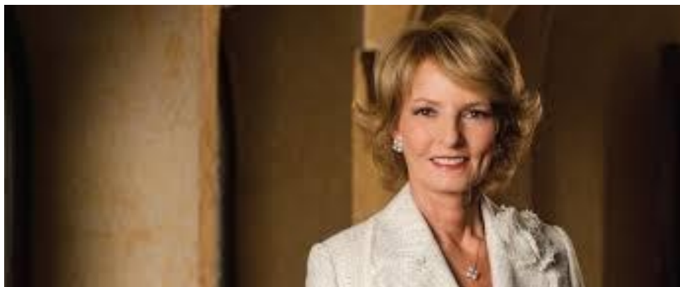
Sa Majesté Margareta, Gardienne de la couronne de Roumanie

La Reine Marie peut représenter aujourd’hui encore une source d’inspiration pour toutes les femmes intelligentes, courageuses, charmantes qui, même si elles ne portent pas la couronne royale, veulent défendre les valeurs auxquelles elles croient, veulent surmonter les difficultés et léguer quelque chose d’inaltérable. Notre contemporaine, Sa Majesté Margareta, l’arrière-petite-fille de la reine, est une preuve vivante que le modèle féminin et royal de la Reine Marie continue d’exister.