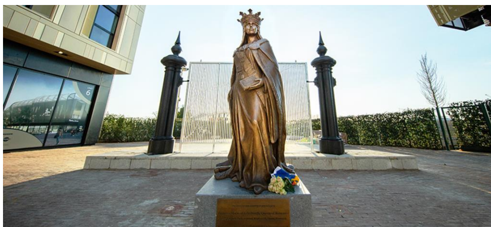
Statue de la Reine Marie, œuvre du sculpteur Valentin Duicu, érigée à Ashford

Patrimoine culturel, la Reine Marie de Roumanie, statue, Ashford.