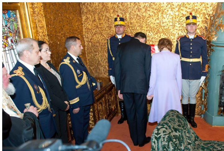
Le cœur de la Reine Marie est déposé au Château Pelișor

Un des moments les plus inattendus de ce parcours artistique personnel a été l'exposition du Château Pelișor, inaugurée le jour même où le cœur de la Reine Marie revenait du Musée National d'Histoire dans la Chambre d'or de ce château splendide que la reine avait tant aimé. Après deux ans pendant lesquels, avec le projet Zestrea , j'avais parcouru des milliers de kilomètres et traversé huit pays européens, me voilà à Siniaia le jour même où on ramenait à la maison le cœur de la reine - on le ramenait là où elle avait rendu l'âme.