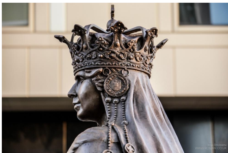
Ashford. La statue de la Reine Marie (détail), œuvre du sculpteur Valentin Duicu