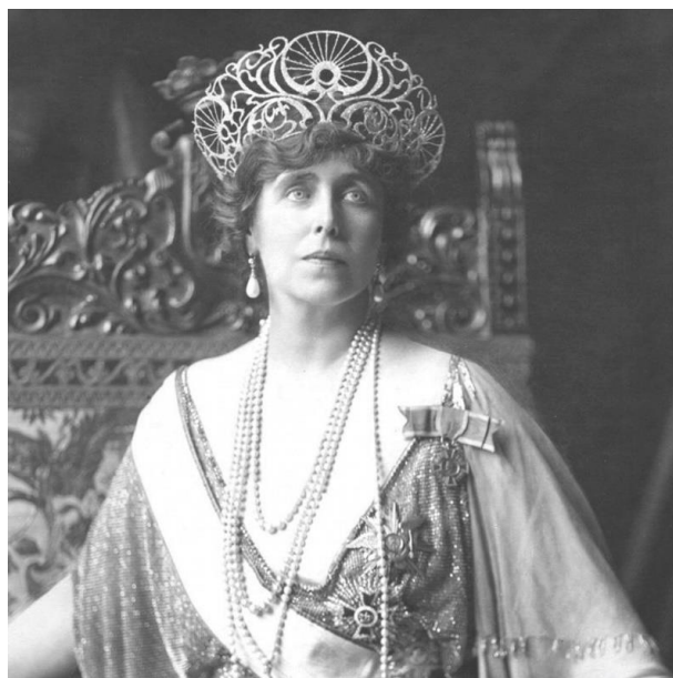
La Reine Marie sur le trône de Roumanie

Même si les grands mérites de la Reine Marie ont été mondialement connus et reconnus de son vivant, la postérité ne se les rappelle à leur juste valeur. Là où elle a vu le jour son souvenir s'est estompé avec les années, et dans son pays d'adoption, en Roumanie, le régime communiste a interdit, pendant plusieurs décennies, la mention de ses faits. Pourtant, à l'image de cette reine qui n'a jamais accepté la défaite, sa mémoire ne s'est pas totalement effacée. Trois décennies après la chute du communisme, la Reine Marie est de plus en plus connue, de plus en plus aimée en Roumanie. Et même en Angleterre, grâce aux projets que l'ICR a déroulé dans le comté de Kent et surtout grâce à la statue qui y fut érigée. La Reine Marie de Roumanie revient donc dans la mémoire des habitants de sa terre natale.