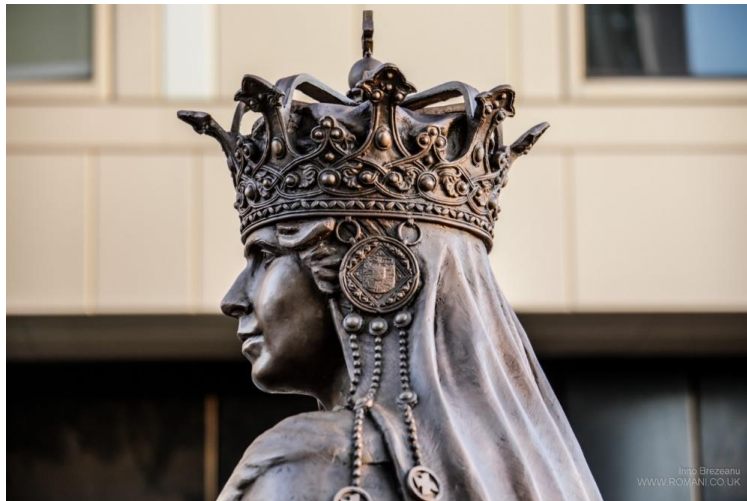
Ashford. La statue de la Reine Marie (détail), œuvre du sculpteur Valentin Duicu