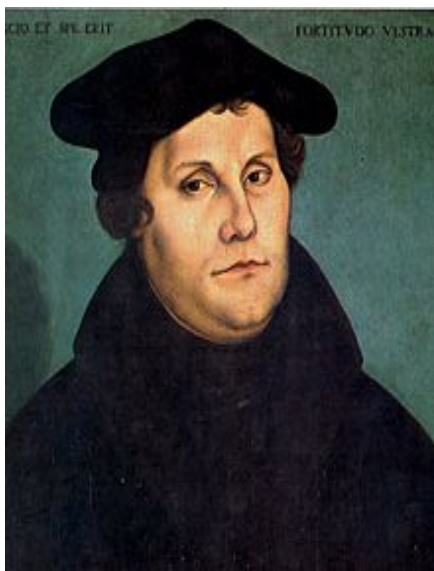
Fig. 4: Martin Luther, portret din anul 1529, de Lucas Cranach cel Bătrân.