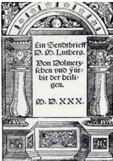
Fig. 3: Ein Sendbrief D. M. Luthers. Von Dolmetschen und Fürbit der heiligen. Ediția publicată, în 1530, la Nürnberg de Wenzeslaus Linck.