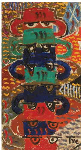
Fig. 6. Ion Țuculescu, Înălțare , ulei pe pânză, 71 x 39 cm, semnat stg. jos monogramă TUC, [1960-1962]

Piese de referință în ansamblul picturii lui Ion Țuculescu, lucrările din patrimoniul colecției țîrgumureșene ilustrează elocvent fiecare dintre perioadele de creație parcurse de artist. Ele sunt mărturia modului original și inconfundabil, de esențializare a gândului și trăirii, asociată abstracției expresioniste, străbătute de fiorul liric.