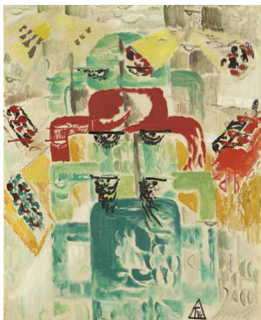
Fig. 5. Ion Ţuculescu, Nostalgie , ulei pe pânză, 100 x 81 cm, semnat stg. monogramă TUC, [1957-1959]

Noua perioadă, totemică, aduce cu sine o epurare a limbajului plastic și a organizării formale, conferind o structură diferită imaginii. Prefigurat în mai multe pasteluri, motivul simbolic definește o lume primară, restrângându-se la „ trei ideograme obsesive - ochiul, troița, totemul... (ochii repetați dau troița, troița repetată dă totemul, totemul echivalează întreaga compoziție) ” 18