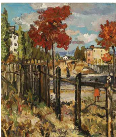
Fig. 1. Ion Țuculescu, Peisaj , ulei pe pânză, 54,5 x 46,5 cm, semnat stg. jos I. Țuculescu, [1935-1937]

fugă, pentru ca al doilea punct de fugă să fie pe linia mediană a tabloului, prins în mica construcție din fundal, accentuată de albul luminos. Partea de orizontale e contracarată, în echilibru, de verticalele pe două nivele: unul al verticalelor scurte create de scândurile gardului și al doilea, de clădiri care flanchează compoziția și de cei doi copaci cu frunzișul de un roșu pregnant. Lucrarea relevă o fază cadrată încă în sfera căutărilor, a definirii stilului de mai târziu.