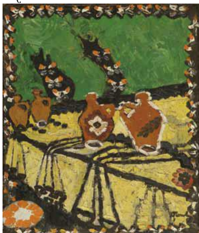
Fig. 4. Ion Țuculescu, Ulcioare , ulei pe pânză, 53,5 x 46 cm, semnat stg. jos I. Țuculescu [1950-1954]

Bordura folosită e un alt element preluat din „limbajul” țeserii covoarelor de la țară, cu aceeași funcție decorativă, în ambele cazuri. E repetat în pastă pasul în „x” al acului pe pânză, rezultând mici fluturi oranj, ca într-o delicată broderie. Despre covoare și măiestrită tehnică a realizării lor, pictorul Francisc Șirato are câteva remarci relevante, pe care le regăsim aplicate puternic personalizat, mai apoi, la Țuculescu: „Un covor țărănesc se prezintă ca o individualitate artistică. Chenarul îl izolează și-i definește limitele și existența în mediu. Spațiul - fondul covorului - e unitar în culoare, iar ornamentul clar, în forme precise, cu o distribuție precisă prin echilibrul său de ritm... Esența formală în arta țărănească este pretutindeni precisă și clară în caracter. Culoarea înviorează forma, fără a o distruge.” 9