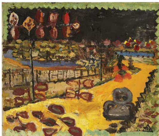
Fig. 3. Ion Țuculescu, Drum de țară , ulei pe pânză, 47,6 x 56 cm, semnat stg. monogramă TUC, [1945-1947]

peisaje, fără o ordine și logică prestabilite, relevând acea simbioză dintre om și natură. Cu siguranță ele prefațeau ceea ce va urma.