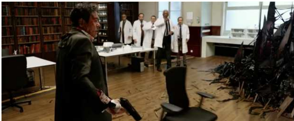
Figure 10: Lucy (Luc Besson, 2014) Source: DVD