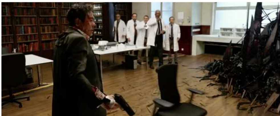
Figure 10: Lucy (Luc Besson, 2014)