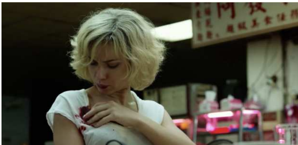
Figure 4: Lucy (Luc Besson, 2014)