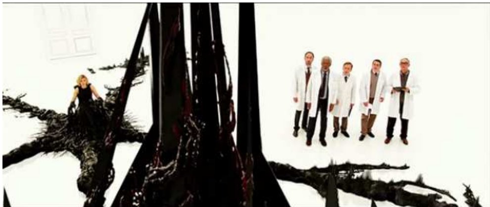
Figure 9: Lucy (Luc Besson, 2014)