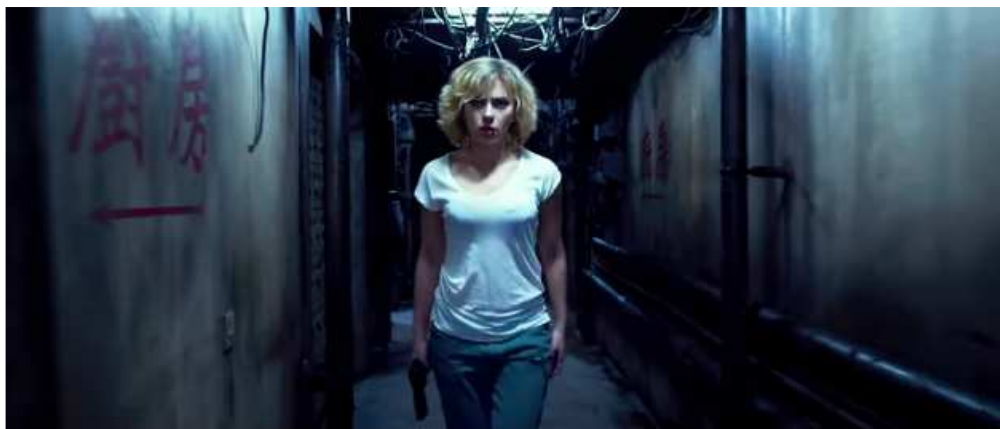
Figure 2: Lucy (Luc Besson, 2014)