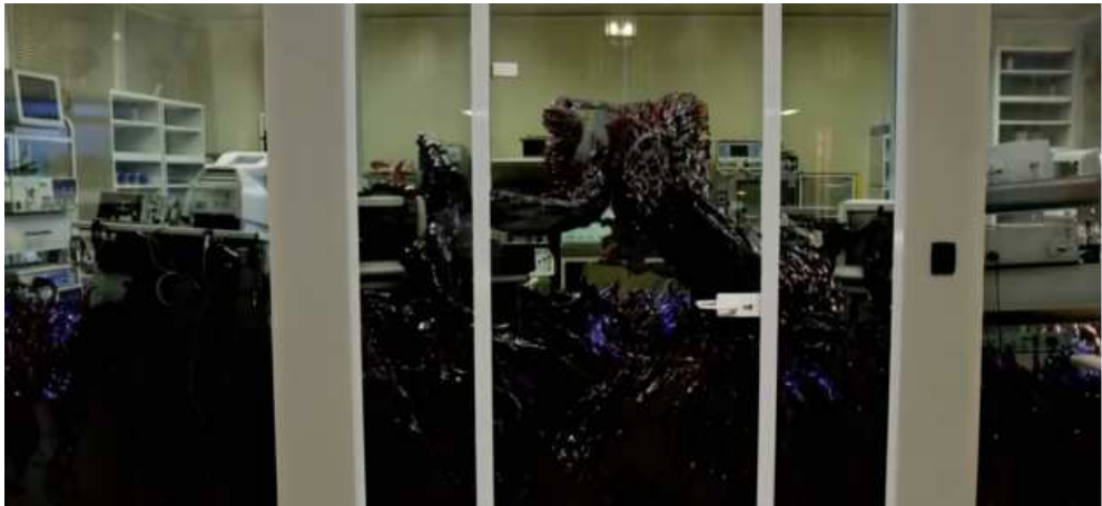
Figure 8: Lucy (Luc Besson, 2014)