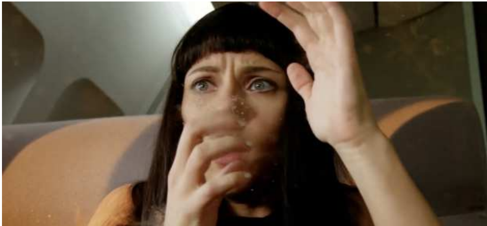
Figure 7: Lucy (Luc Besson, 2014)