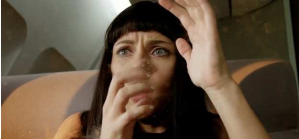
Figure 7: Lucy (Luc Besson, 2014)