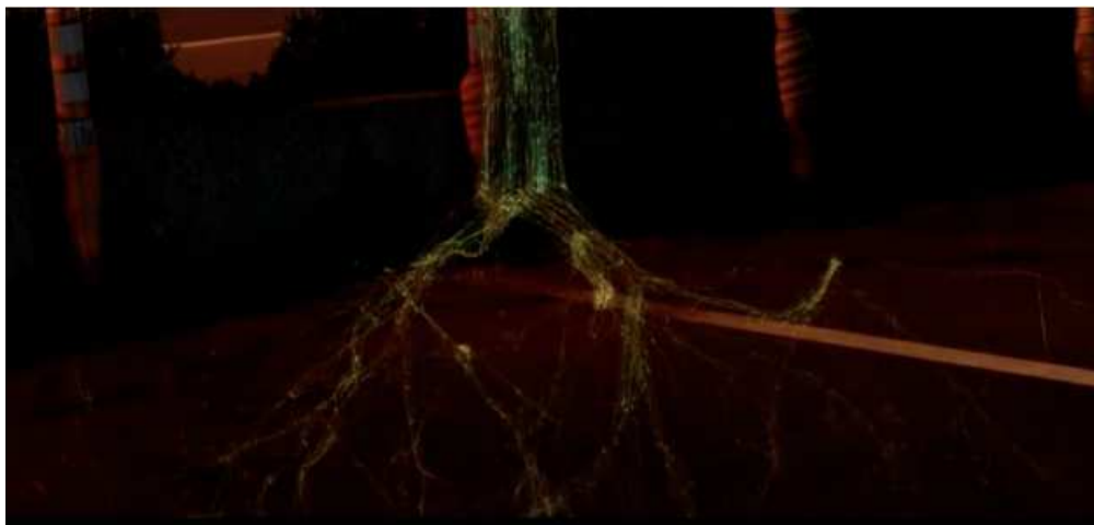
Figure 3: Lucy (Luc Besson, 2014)