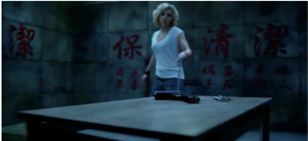
Figure 1: Lucy (Luc Besson, 2014)