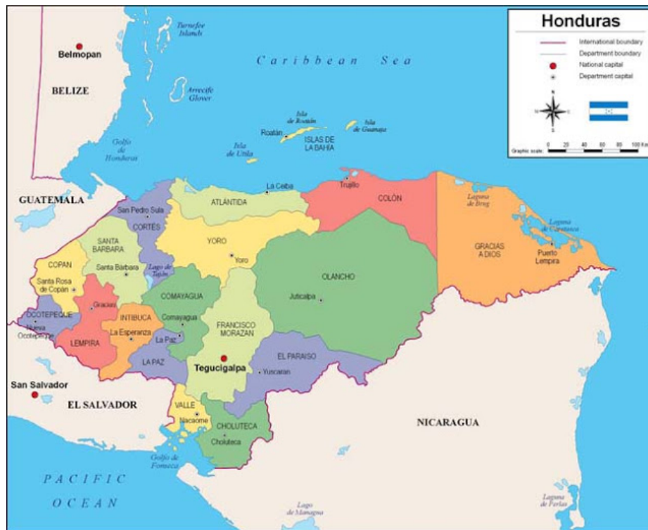
FIGURA 1. Mapa de la división política de Honduras.