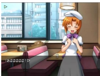
Fig. 1.-Imagine preluată din jocul ひぐらしのなく頃に 2 (07th Expansion)

Visual Novel , după cum sugerează și numele, este un joc ce se bazează strict pe narațiune și dialog acompaniate de imagini, sunet și scurte animații. Gradul de interactivitate este unul scăzut, întrucât jucătorul are un set restrâns de opțiuni predefinite.