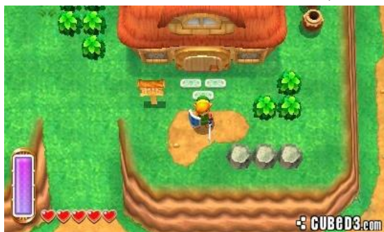
Fig.2.2- ゼルダの伝説 神々のトライフォース 2 8 (2013)

Cititorul este de asemenea implicat și în construirea relațiilor spațiale. Deși există loc disponibil pentru desfășurarea acțiunilor, detaliile precum copacii, pietrele și ușile încuiate servesc atât ca punct de referință în spațiu cât și ca impediment.