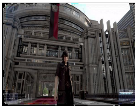
Fig. 3.1- Final Fantasy XV previzualizare gameplay

Fiecare joc prezintă personaje diferite, însă este păstrată o temă comună precum cea a dualității și cea a echilibrului dintre bine și rău (răul neputând fi eradicat ci doar subjugat sau izolat). Elementul de noutate pe care aș dori să îl subliniez constă în raportul de rivalitate ce se formează între cititor și inteligența artificială prezentă în joc, unde conflictul dintre două personaje nu se rezumă doar la un nivel textual ci ajunge până într-un punct în care se stabilește o rivalitate metatextuală, exemplul concret pentru o astfel de situație fiind prezent în Final Fantasy VII. Acest joc oferă un bun exemplu de îmbinare a narațiunii cu mecanicile jocului atât pentru a mări gradul de