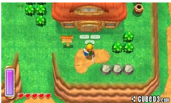
Fig.2.2- ゼルダの伝説 神々のトライフォース 2 8 (2013)

Cititorul este de asemenea implicat și în construirea relațiilor spațiale. Deși există loc disponibil pentru desfășurarea acțiunilor, detaliile precum copacii, pietrele și ușile încuiate servesc atât ca punct de referință în spațiu cât și ca impediment.