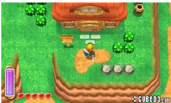
Fig.2.2- ゼルダの伝説 神々のトライフォース 2 8 (2013)

Cititorul este de asemenea implicat și în construirea relațiilor spațiale. Deși există loc disponibil pentru desfășurarea acțiunilor, detaliile precum copacii, pietrele și ușile încuiate servesc atât ca punct de referință în spațiu cât și ca impediment.