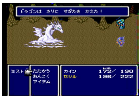
Fig.3- Final Fantasy I & II

Final Fantasy este o serie de jocuri dezvoltată de către compania japoneză Square Enix . Treptat, aceasta a evoluat enorm din punct de vedere grafic, îmbogățind astfel experiența cititorului prin detaliul texturilor care țin locul unei descrieri amănunțite atât a peisajelor cât și a portretelor fizice ale personajelor