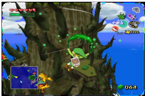
Fig.2.1- 風のタクト 12 (2002) se bazează mai mult pe explorarea lumii virtuale.

Am ales să mă axez pe franciza The Legend of Zelda și nu pe binecunoscutul Mario, deoarece ゼルダの伝説 nu se rezumă la povestea clasică erou-salvează-prințesă ci, aici cititorului i se insuflă principii șintoiste, valori tipic japoneze, deoarece, Zelda trebuie să ducă la bun sfârșit nenumărate sarcini ( în aparență triviale) pentru a strânge resursele necesare pentru a obține echipamentul potrivit cu ajutorul căruia luptă împotriva răului, a superficialității, demonstrând prin efortul depus faptul că nici un lucru nu este neînsemnat și că dincolo de suferință există întotdeauna un scop, o finalitate .