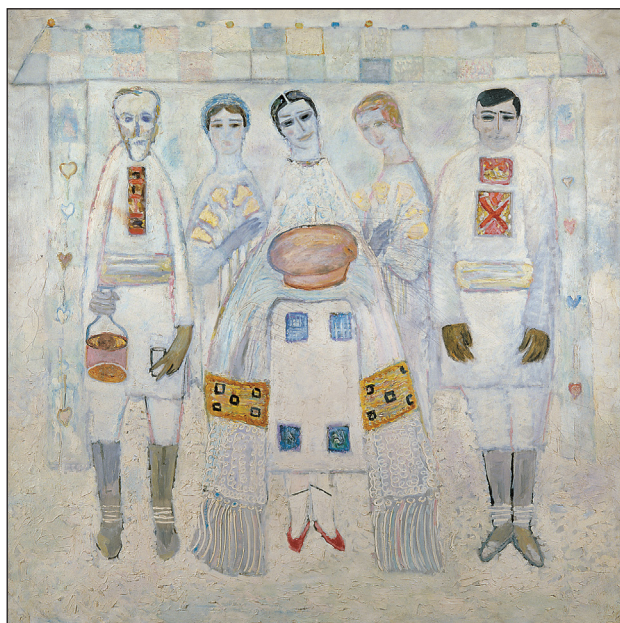
Mihail Grecu. Ospitalitate . 1965–1967, ulei pe pânză. 200 × 200 cm

7. Draganovici Eve-Marie. Übersetzungen audiovisueller Werbung für deutsche Konsumgüter: Traducerea textului publicitar în mediul audiovizual din limba germană în limba română. Teză de doctorat, rezumat. București, 2010. 31 p. Disponibil la: http://www.unibuc.ro/studies/Doctorate2010Martie/Draganovici%20Evemarie%20-%20Traducerea%20textului%20publicitar%20in%20mediul%20audio-vizual/Rezumatul%20tezei.pdf (Vizitat la 13.10.2015).