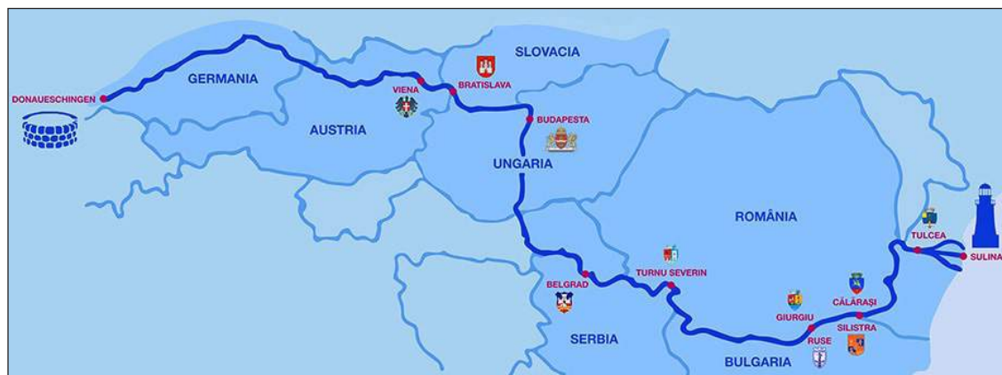
Figura 1. Dunărea europeană.

Dunărea, după cum s-a menționat, s-a format acum câteva milioane de ani, când s-au eliberat de ape și au ieșit la suprafață munții Carpați și când s-au retras din spațiile intramontane mările Badeniană, Sarmațiană, Meoțiană și Pontiană. În Cuaternar și-a făcut apariția în regiunile noastre omul. Într-un târziu, omul a dat nume obiectelor geografice din mediul ambiant, munților, râurilor, dealurilor, văilor etc. Cum se va fi numit inițial însuși fluviul, bineînțeles, nu se știe.