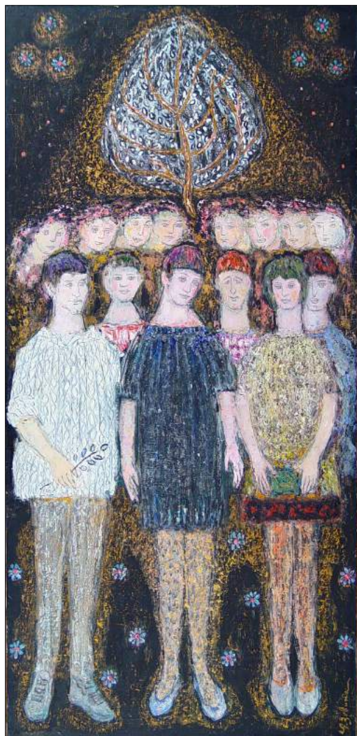
Ada Zevin. Gaudeamus , 1968, u/p, tempera, 115 × 74 cm