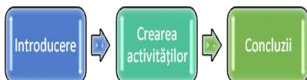
Figura 1. Etapele unui Subject Sampler.

La realizarea unui Subject Sampler se parcurg următoarele etape (figura 1):