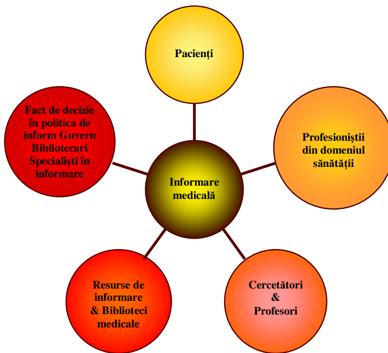
Fig. 4. Procesul de informare medicală

Misiunea acestui Grup Medical este să contribuie la dezvoltarea cunoașterii medicale din Turcia, să ridice standardele informării din științele medicale din Turcia la nivelul existent pe plan internațional și să ofere informații precise și actualizate profesioniștilor din științele medicale.