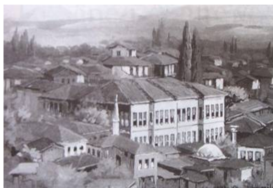
Fig. 2. Prima clădire a școlii medicale (Tıphane ve Cerrahhane-i Amire, Tulumbacıbaşı, Pictor Ahmet Yakupoğlu)

Odată cu reforma universităților care a fost inițiată în 1933, prima școală medicală din țară a fost înființată sub numele de Facultatea de Medicină din Istanbul. În 1967, aceasta a fost împărțită în două școli medicale – Școala Medicală din Istanbul și Școala Medicală Cerrahpaşa. (Fig. 3) (3)