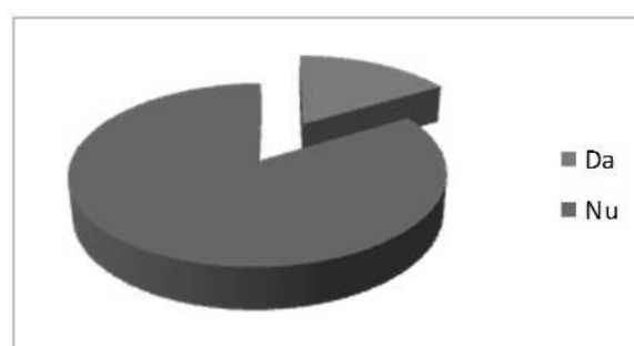
Figura 2 Comunicarea bibliotecii cu utilizatorii prin intermediul Facebook

A treia întrebare a fost dacă li s-au trimis vreodată anunțuri sau dacă biblioteca a comunicat vreodată cu ei prin intermediul Facebook. 46 de studenți au dat un răspuns negativ și doar 9 studenți au declarat că biblioteca s-a conectat cu ei prin intermediul Facebook și au spus că au primit anunțuri cu privire la diverse acțiuni desfășurate în bibliotecă sau organizate de bibliotecă, dar au precizat că nu a existat nici un alt tip de comunicare cu biblioteca. (Figura 2)