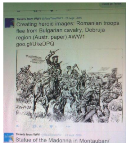
Fig. 1. Lupte între trupele românești și cavaleria bulgară în Dobrogea

Jurnalele, scrisorile, fotografiile, desenele sau poeziile personale sunt folosite pentru descrierea vieții de zi cu zi a oamenilor, indiferent de care parte a baricadei au luptat guvernele lor în timpul războiului.