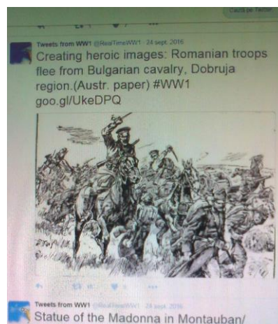
Fig. 1. Lupte între trupele românești și cavaleria bulgară în Dobrogea

Jurnalele, scrisorile, fotografiile, desenele sau poeziile personale sunt folosite pentru descrierea vieții de zi cu zi a oamenilor, indiferent de care parte a baricadei au luptat guvernele lor în timpul războiului.