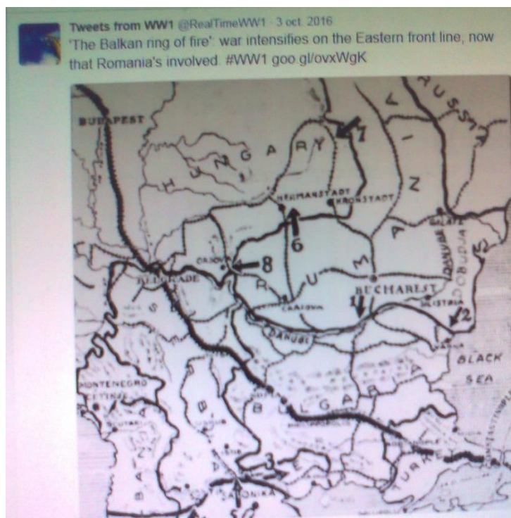
Fig. 2. Ringul de foc al Balcanilor de pe Frontul de Est

În tweet-urile zilnice se pot regăsi lucruri extrem de diverse precum imagini din viața din tranșee, descrieri succinte ale unor bătălii, rapoarte despre costul vieții de zi cu zi, sfaturi medicale, programul unui meniu săptămânal pentru locuitorii din New York, rânduri din jurnalul Reginei Maria a României, fragmente din pagini de ziar precum și alte elemente ce reflect viața de zi cu zi din timpul Marelui Război.