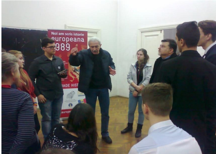
Figura 2. Tineri înregistrând mărturiile unor participanți la Evenimentele din 21 decembrie 1989 Europeana CC BY SA

În acest mod, întreaga manifestare a avut un aspect educativ pronunțat ce a facilitat schimbul de informații și interacțiunea între generații, tinerii având posibilitatea de a afla chiar de la participanții la acele evenimente ceea ce s-a întâmplat în acele zile, ca și unele detalii mai puțin cunoscute ale atmosferei din acele vremuri.