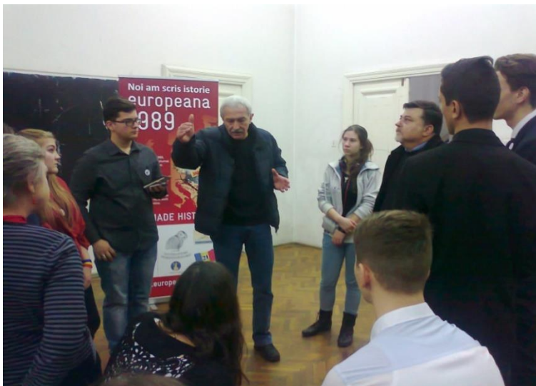
Figura 2. Tineri înregistrând mărturiile unor participanți la Evenimentele din 21 decembrie 1989 Europeana CC BY SA

În acest mod, întreaga manifestare a avut un aspect educativ pronunțat ce a facilitat schimbul de informații și interacțiunea între generații, tinerii având posibilitatea de a afla chiar de la participanții la acele evenimente ceea ce s-a întâmplat în acele zile, ca și unele detalii mai puțin cunoscute ale atmosferei din acele vremuri.