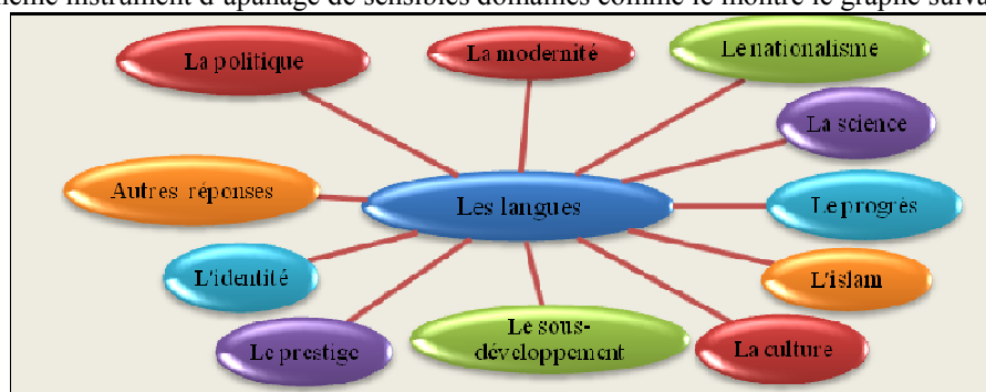
Figure 3 Les domaines référentiels assignés aux langues

En vue d'atteindre les représentations sociolinguistiques de nos informateurs assignées aux deux langues, particulièrement l'arabe et le français, nous avons suggéré, à travers le questionnaire, des domaines référentiels. Pour l'ensemble des référents suggérés, notre choix a été dicté par la surcharge sémantique et connotative qui les caractérise. En termes d'associations référentielles aux langues, il nous est possible de constater que, dans l'histoire de l'humanité, les langues demeurent l'objet de références représentationnelles et même instrument d'apanage de sensibles domaines comme le montre le graphe suivant :